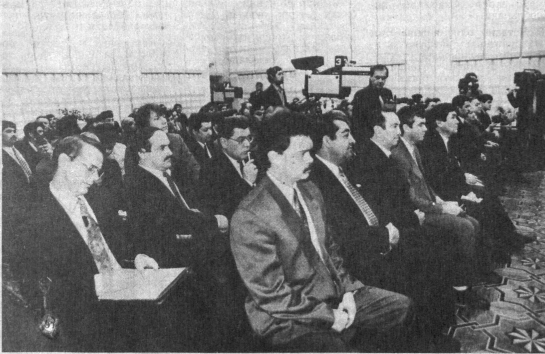
Суратда: матбуот конференцияси пайти.