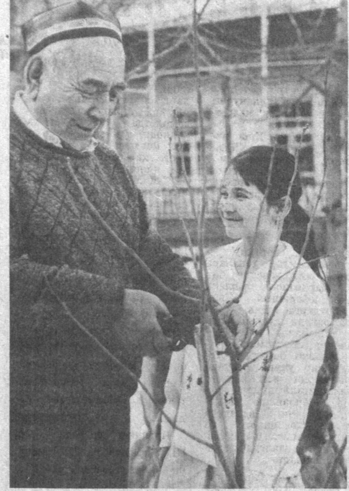
Кўчат экиб, боғ ярат.