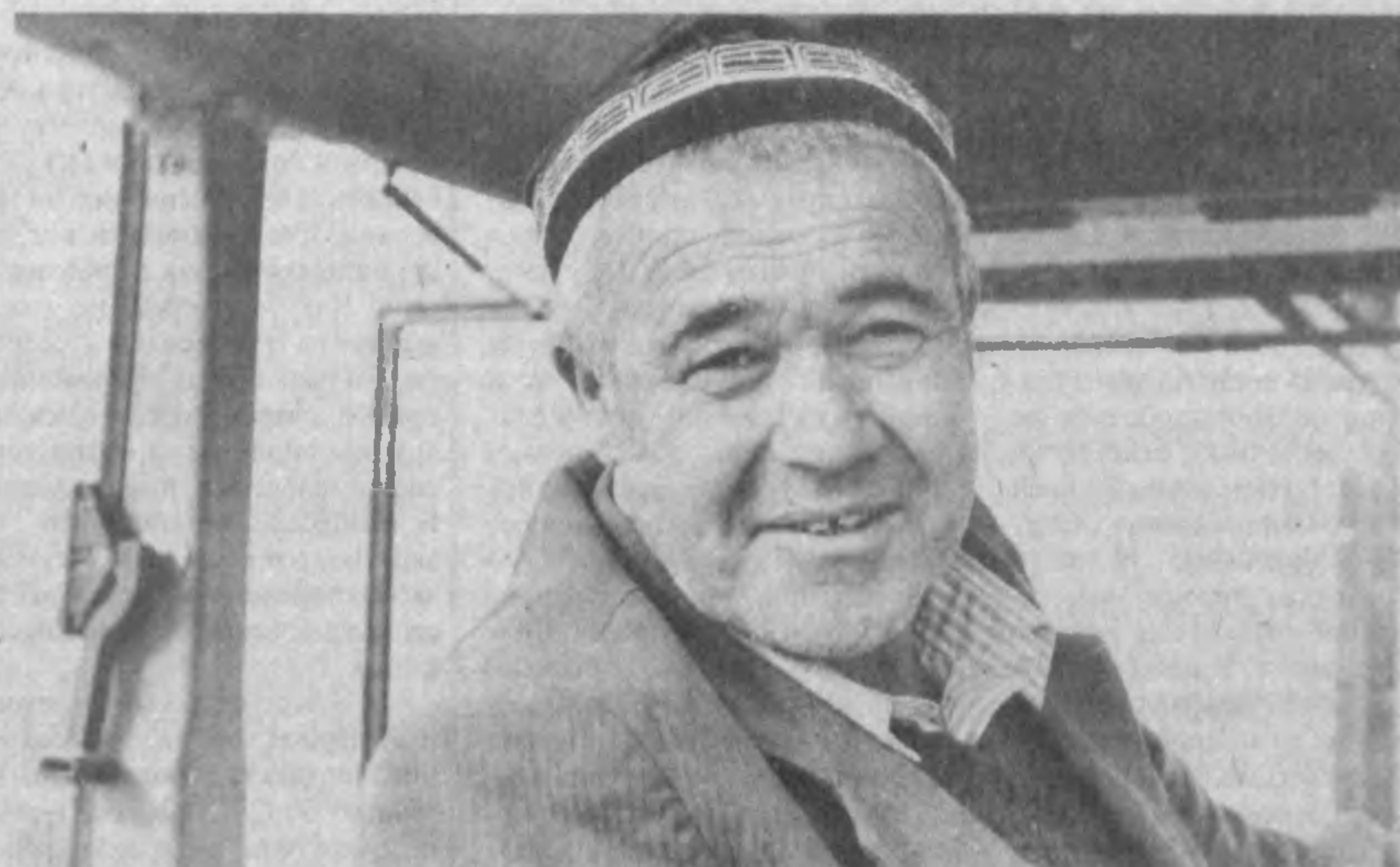
Союз кооператоров «Фергана» Ферганского района недавно закупил партию тракторов «Лазер-150», произведенных в Италии совместно с голландской фирмой «Себеко интернейшнл». Трактор, кроме вспашки, производит еще ряд сельскохозяйственных, вно-

сит минеральные удобрения, перевозит грузы.