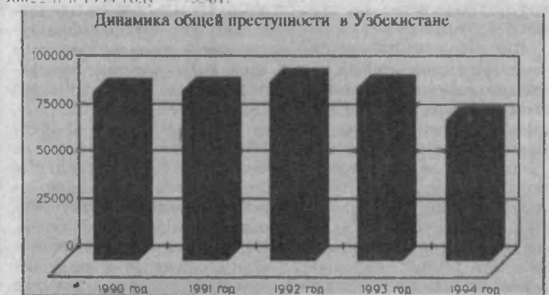
Динамика общей преступности в Узбекистане

В 1994 году преступность в целом по республике претерпела ряд существенных изменений. Прежде всего отмечается заметное снижение общего количества совершаемых преступлений по сравнению с предыдущими годами.