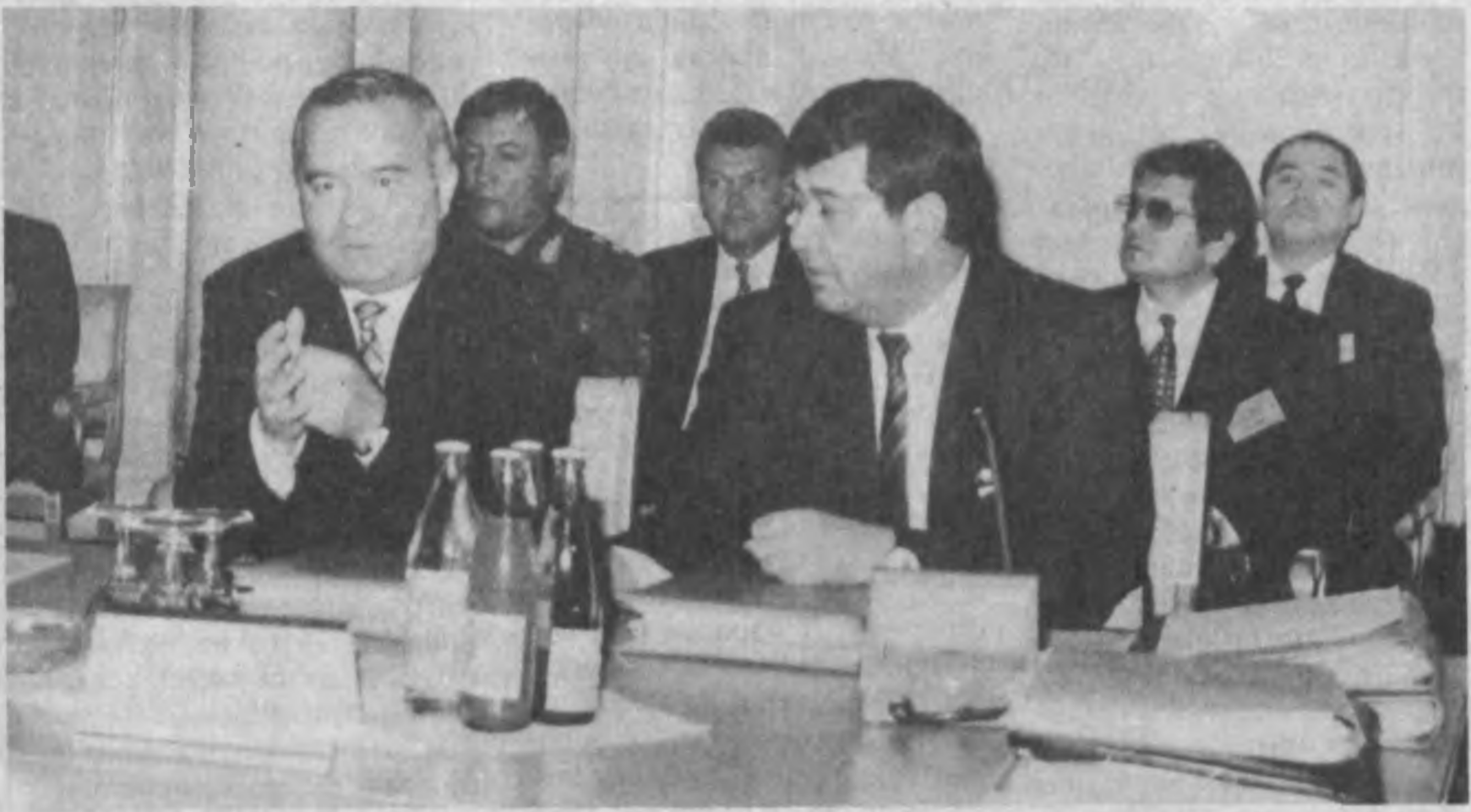
НА СНИМКЕ: во время встречи.

В столице Казахстана городе Алматы 10 февраля состоялась очередная встреча глав государств и правительств стран-членов Содружества Независимых Государств. В ней приняли участие 12 делегаций стран Содружества. Президент Узбекистана Ислам Каримов, отвечая на вопросы журналистов в аэропорту города Алматы, еще раз подтвердил, что интеграция в рамках СНГ является требованием времени. Для участия в этой важной встрече делегации всех стран прибыли в Алматы на день раньше. В Доме дружбы столицы Казахстана 9 февраля состоялась заседание Совета министров иностранных дел и Советов министров обороны стран-членов Содружества. Его участники еще раз обменялись мнениями по вопросам, которые предстояло рассмотреть во время встречи на высшем уровне. Основные события в Алматы состоялись 10 февраля. Во Дворце Президента Казахстана начал работу Совет глав государств стран-членов СНГ. На нем были обсуждены вопросы поддержания мира и стабильности в СНГ, согласования мер по восстановлению и сохранению общего национального пространства, охраны внешних границ государств Содружества, решения организационных вопросов Межгосударственного экономического комитета, празднования 50-летия Победы над фашизмом, другие вопросы. Одновременно в Президентском дворце состоялось заседание Совета глав правительств стран СНГ. На совете глав правительств были рассмотрены вопросы, связанные с взаимным правовым урегулированием хозяйственных отношений, созданием общественной базы Экономического союза, совершенствованию