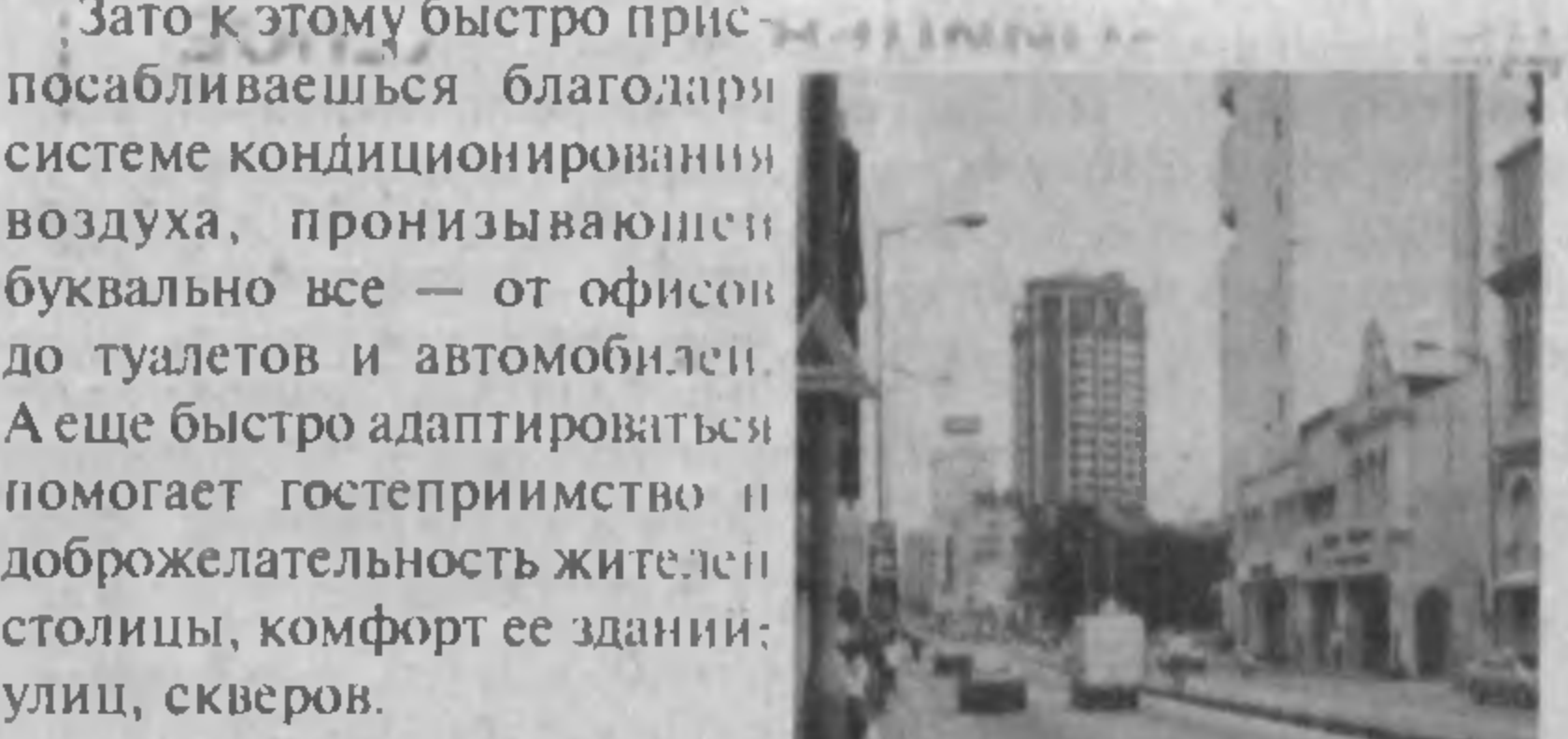
НА СНИМКЕ: Куала-Лумпур, город, в котором нет зимы даже в феврале.

Жителям регионов с континентальным климатом и, в частности, узбекистанцам, поначалу не очень комфортно вблизи экватора, например, в столице Малайзии Куала-Лумпуре.