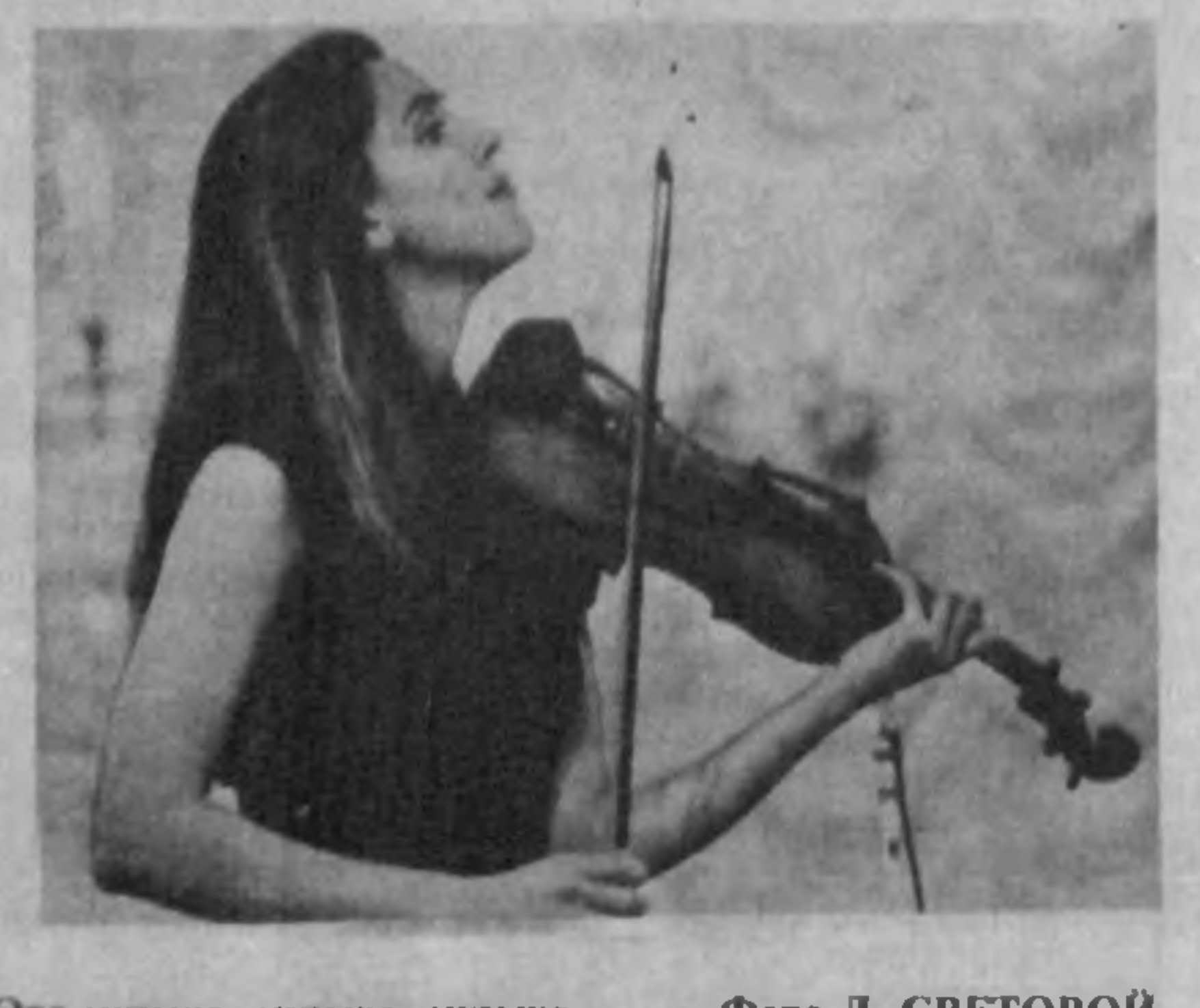
Это музыка, музыка, музыка...

Зимний чемпионат Узбекистана, о котором было рассказано в упомянутой публикации, очертил довольно широкий круг претенденток на поездку: как минимум у семи спортсменок были серьезные шансы занять место в командном квартете сборной. Решающее слово оставалось за самими девушками.