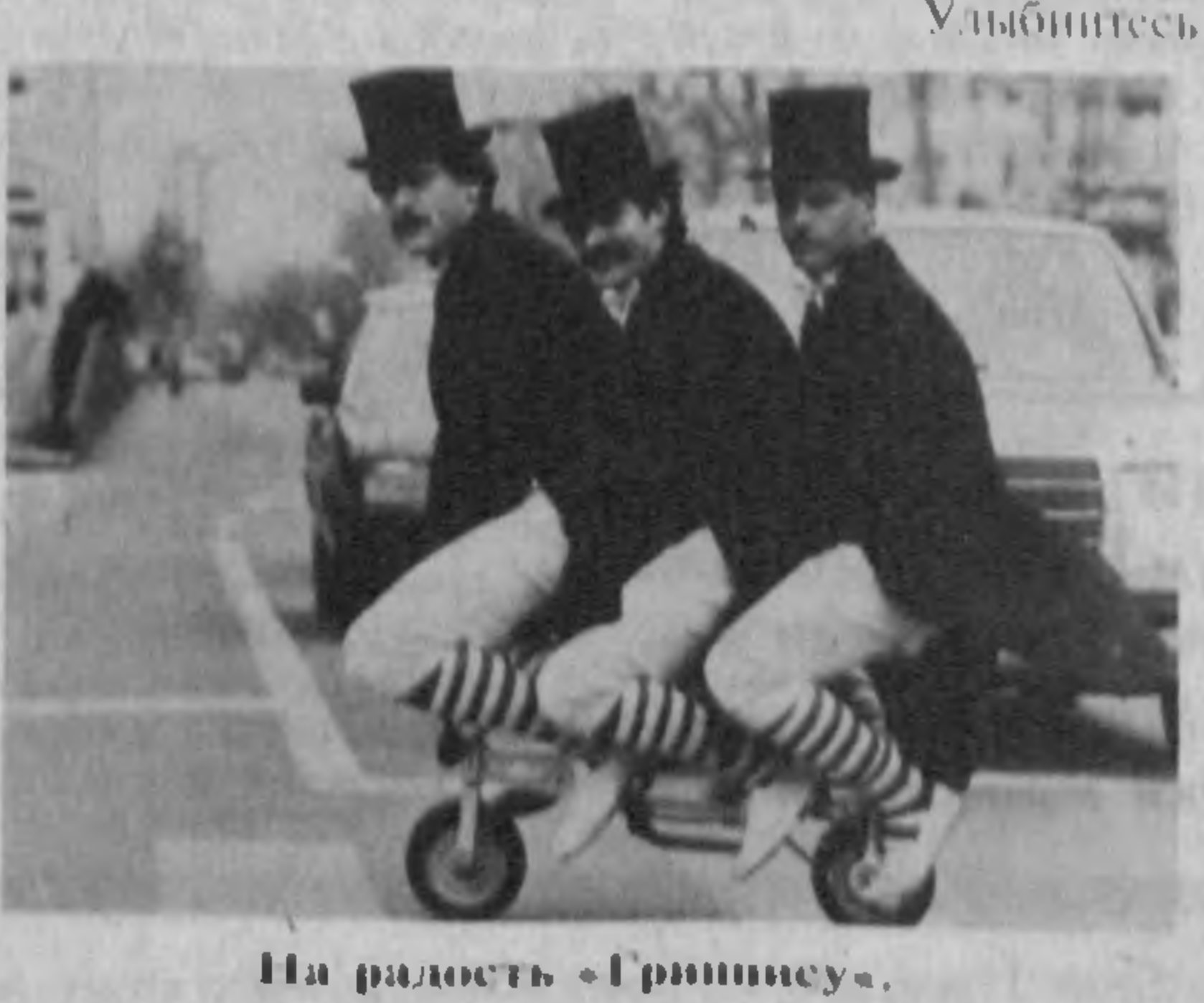
На радость «Гринпису».

Тайный город, возведенный нацистами в бразильском сельце, сообщил А. Морена, именовался Анакор или Анкора. В преддверии краха нацистов в Европе, скрываясь там, Гитлер решил устроить там лагерь.