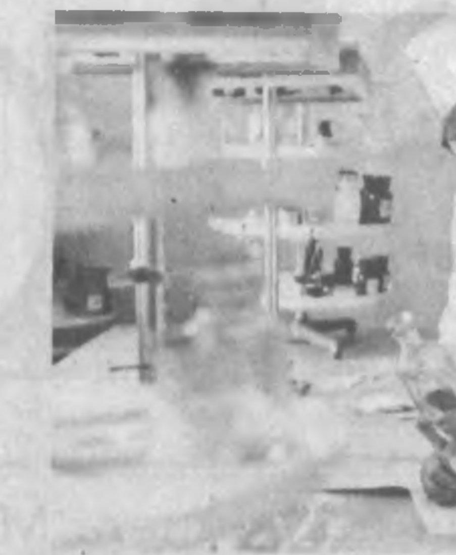
В аптеке создана аптека, в шести отделах которой есть практически все необходимые фармацевтические группы.