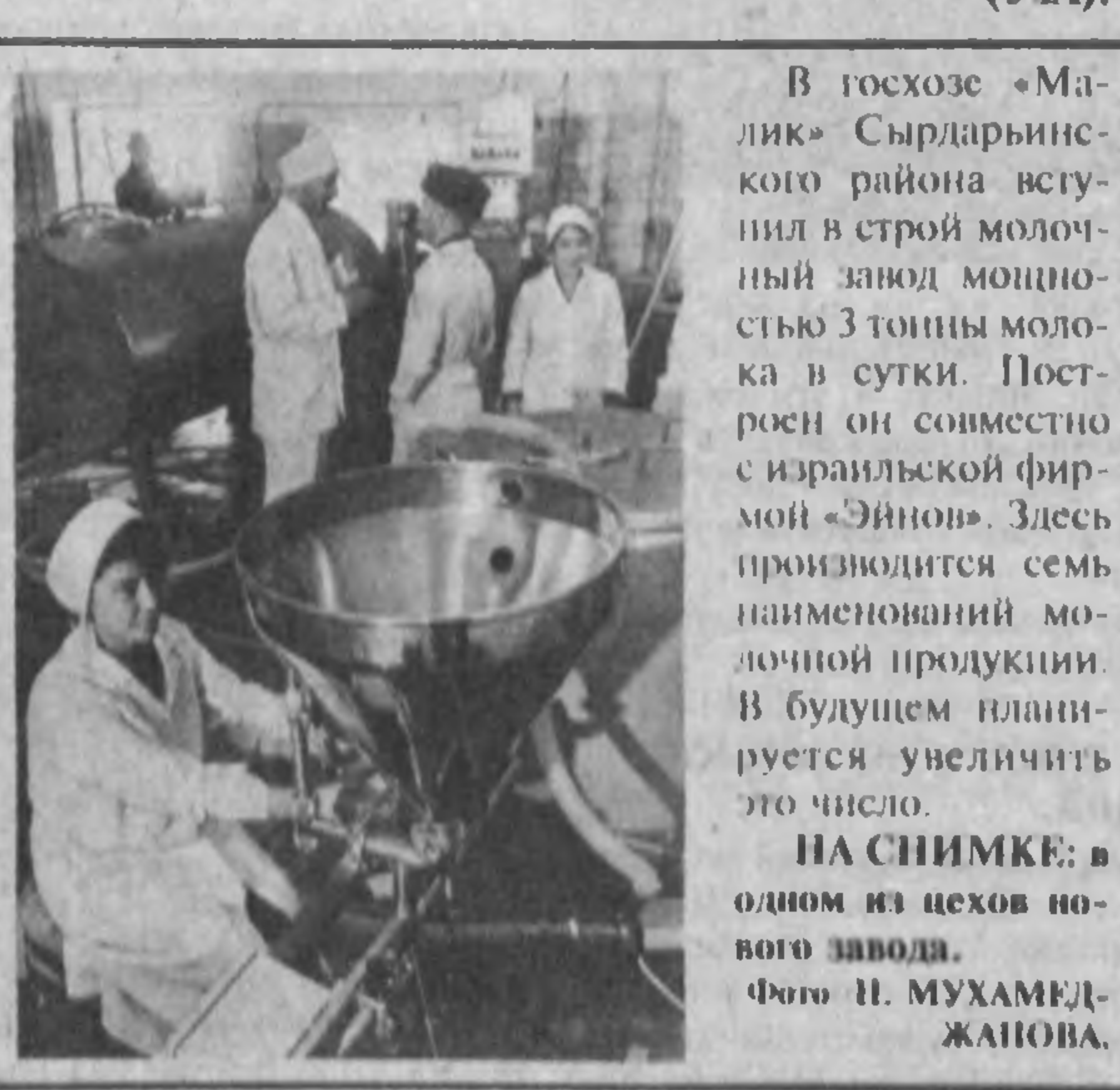
В госхозе «Малик» Сырдарьинского района вступил в строй молочный завод мощностью 3 тонны молока в сутки. Построен он совместно с израильской фирмой «Эйнон». Здесь производится семь наименований молочной продукции. В будущем планируется увеличить это число. НА СНИМКЕ: в одном из цехов нового завода.

На сессии выступил хоким области Э. Рузиев.