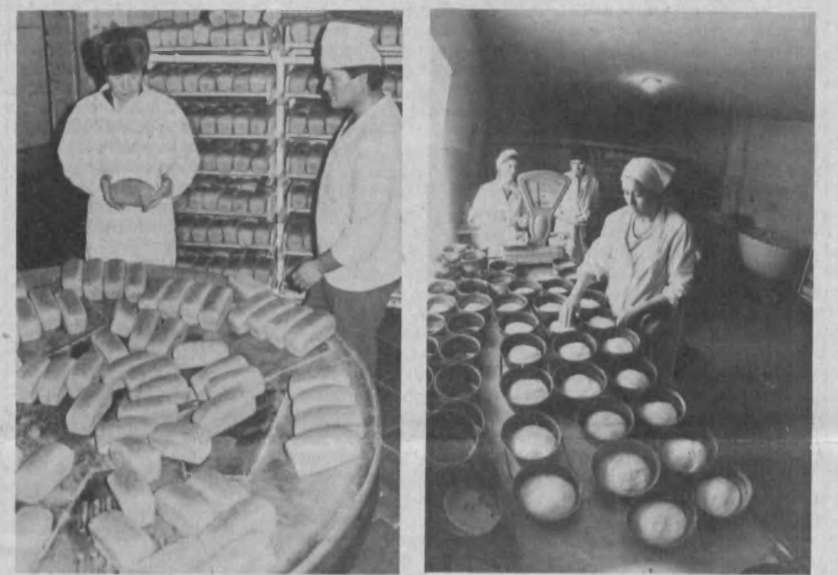
Л. ГАВРИЛОВА, наш корр.

Есть в Джизакской области бизнесмены, деятельность которых позволяет им достойно участвовать в конкурсе на звание лучшего предпринимателя года. Узбекская земля богата талантами, и, наконец, изготовление обуви и других изделий из кожи.