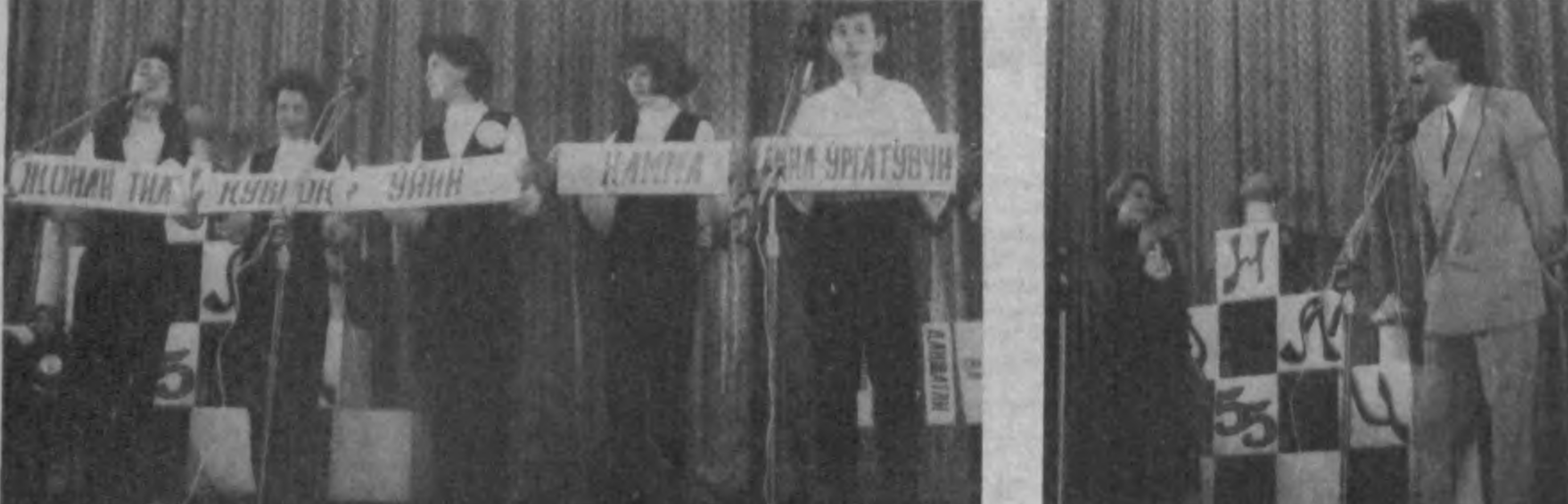
Мы живем в Узбекистане