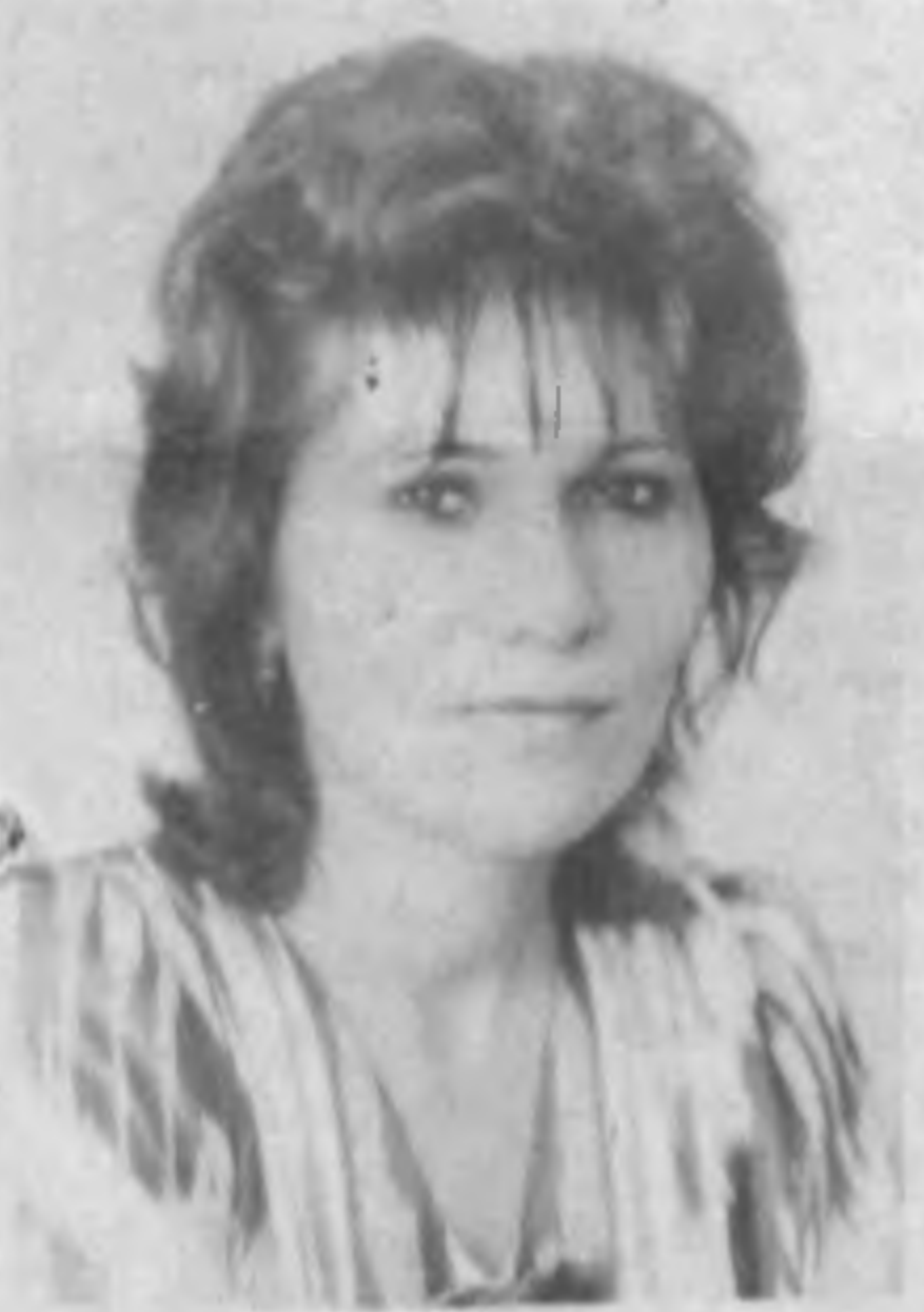
Вот и вновь весна на пороге. У нас, на южных широтах, она так же долгождана...