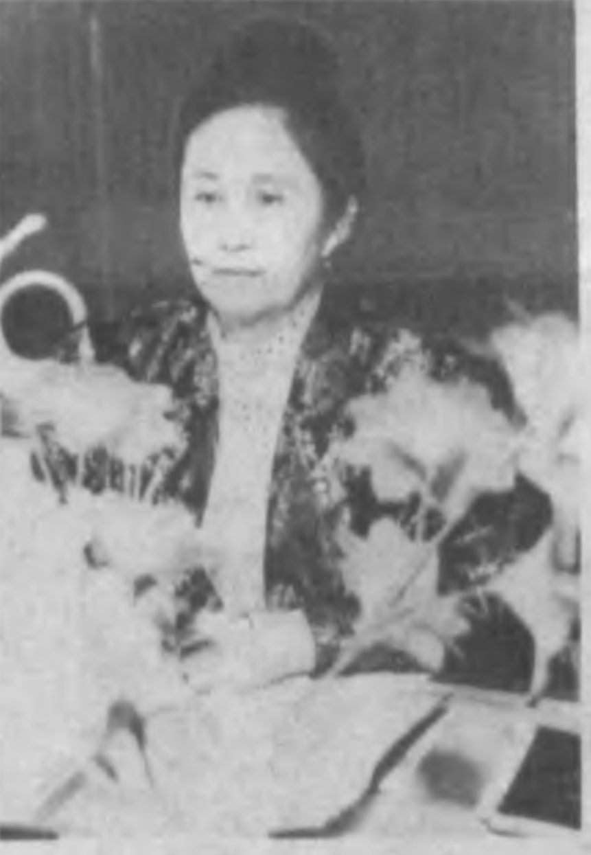
Многие. Но есть нечто, что отличает этих женщин: они интересные люди...