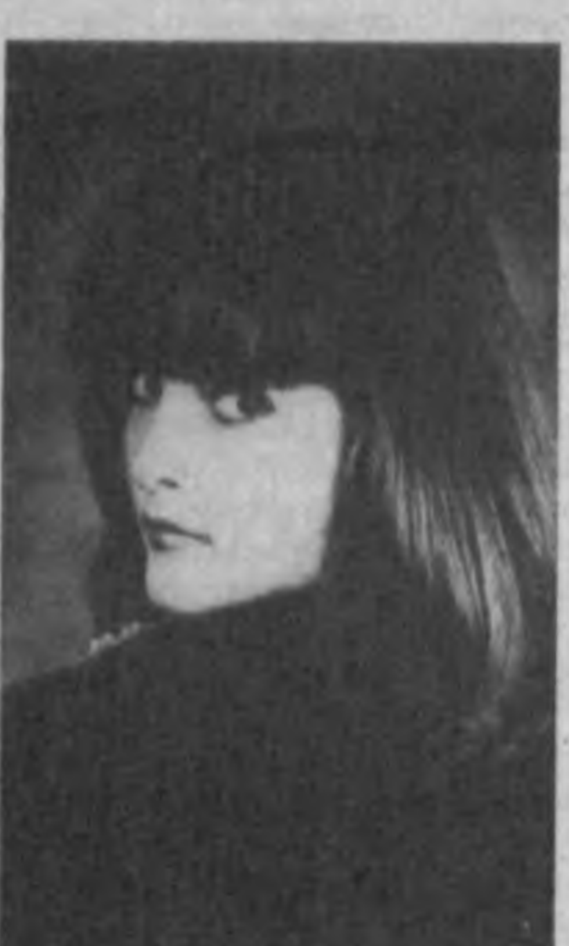
Фотохудожник: женщина XX века. Гаммой дела обстоит куда сложнее.

«Это как? — спросила я тупо. — Но это и неважно, у меня все равно нет этого маленького черного платья. И вряд ли когда-нибудь будет», — добавила и мысленно. «Ну тогда какую-то короткую, но очень приличную юбку, блузку, жакет — все в соразмерности и гамме, — сочувственно и безнадёжно посоветовали в трубку». «Да, соразмерности может показать и не придется, но вот с