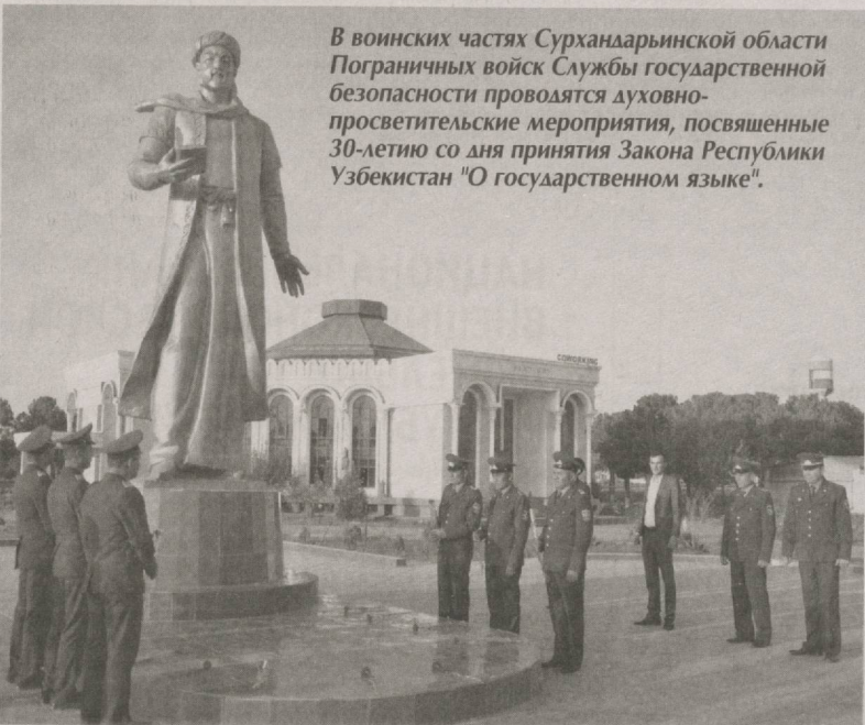
В воинских частях Сурхандарьинской области Пограничных войск Службы государственной безопасности проводятся духовно-просветительские мероприятия, посвященные 30-летию со дня принятия Закона Республики Узбекистан "О государственном языке".

На одном из таких мероприятий, организованном в Термезе, особо отмечалось, что принятый тридцать лет назад 21 октября Закон Республики Узбекистан "О государственном языке" создал прочную правовую базу, сыграл важную роль в придании нашему родному языку высокого статуса. Был признан тот факт, что сегодня узбекский язык широко применяется в сфере государственного и общественного управления, межгосударственных отношений, науки, образования и воспитания, медицины, спорта, культуры, искусства, а также в военной сфере. Состоялся обмен мнениями о том, что на проводимых в различных странах мира мероприятиях звучит наш родной язык, что повышает гордость каждого гражданина нашей страны.