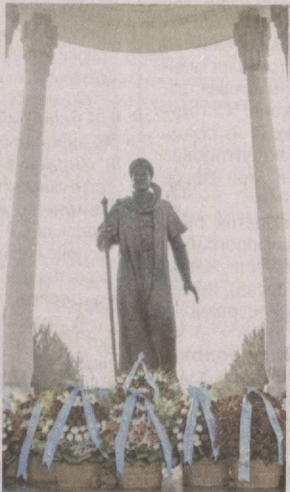
По материалам корреспондентов УзА.

Со времен тех событий минуло тридцать лет. Выступившие на мероприятии отметили, что в годы независимости сформировался новый дипломатический узбекский язык.