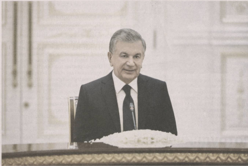
Президент Республики Узбекистан Шавкат Мирзиёев 22 октября принял находящуюся в нашей стране с визитом делегацию штата Гуджарат Республики Индия, возглавляемую главным министром штата Виджаем Рупани.

Тепло приветствуя гостей, глава нашего государства особо отметил динамичное развитие многопланового сотрудничества, укрепление дружбы и стратегического партнерства между Узбекистаном и Индией.