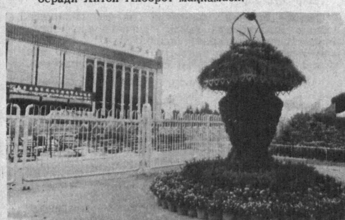
Уруғчи (Хитой) гуллар шаҳри.

Ишни бошлаш учун 80 миң нафар аҳолини бошқа жойга кўчириш ва уларни ўй-жой билан таъминлаш зарур. Бундан ташқари, қурилиш учун зарурий маблағ масаласи ҳам катта муаммо бўлиб турибди, деб хабар беради Хитой Ахборот маҳкамаси.