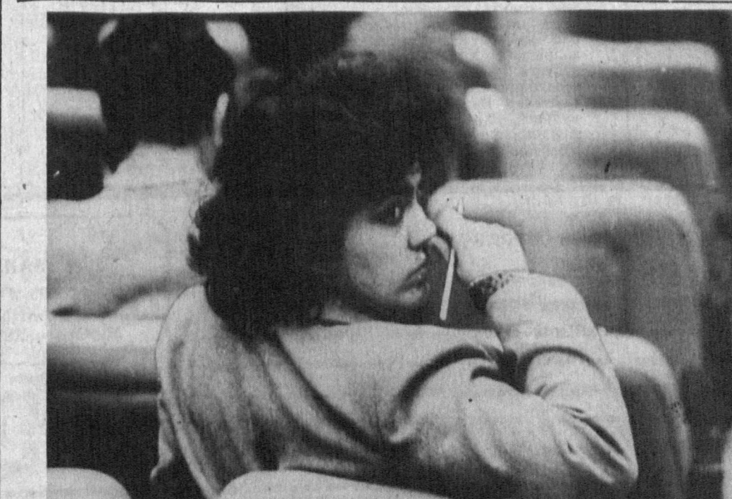
Буюк мамлакатнинг буюк фарзанди, Ёшлар кўлини сени Ватан кутади.

Ҳозирги пайтда республикамизда а г и 100 га яқин гимназия, 15 та ёшларнинг 25 миң нафар иқтисодий ёшлар тахсил олинмоқда.