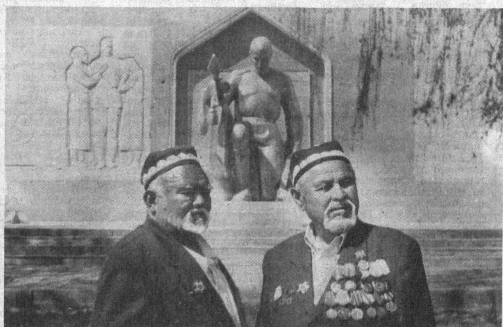
Эркин ВОҲИДОВ, Ўзбекистон халқ шоири.