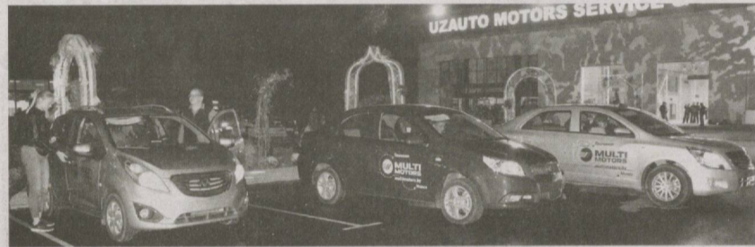
В Ташкенте состоялось открытие сервисного и торгового центра "UzAuto Motors Service & Trade-In Center". Здесь есть возможность обменять подержанный автомобиль на новый с доплатой по системе "Trade-in".