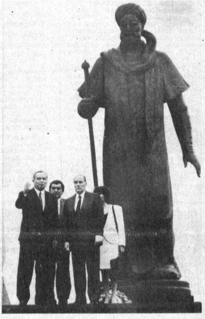
СУРАТДА: Алишер Навоий ҳайкали пойида.