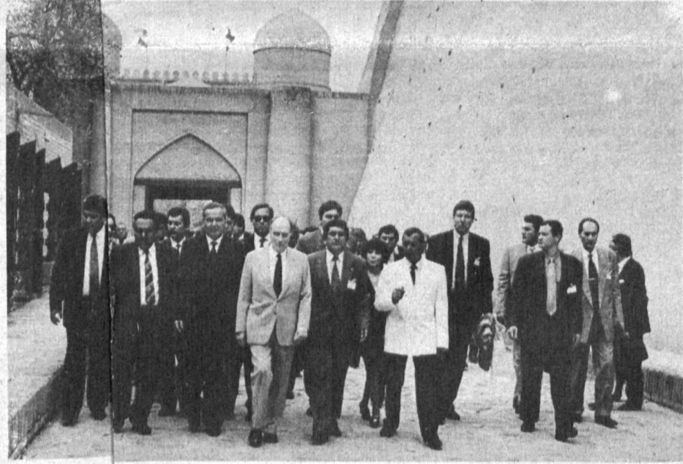
СУРАТДА: Хоразм заминда. (ЎзА).