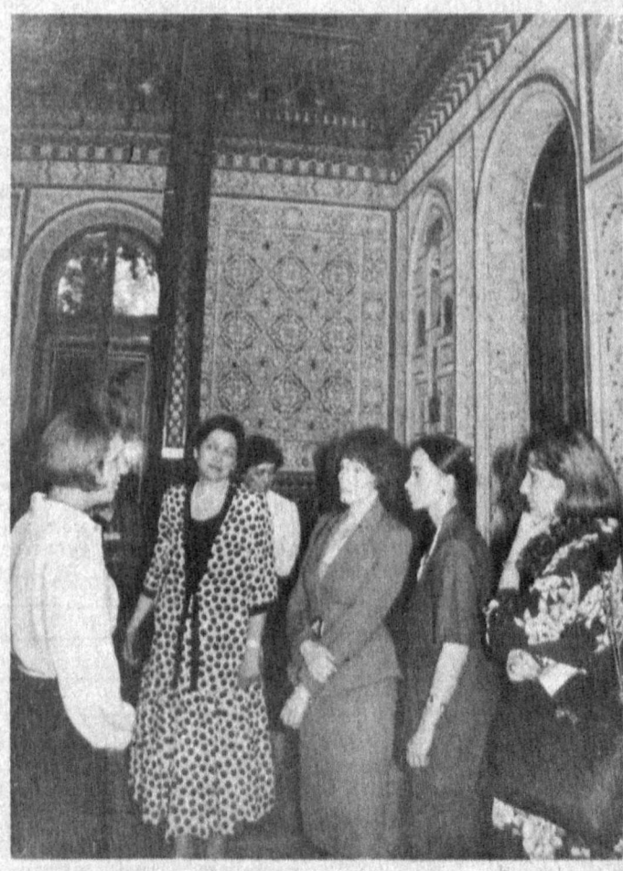
СУРАТДА: Президентларнинг рафиқалари амалий санъат музейида.