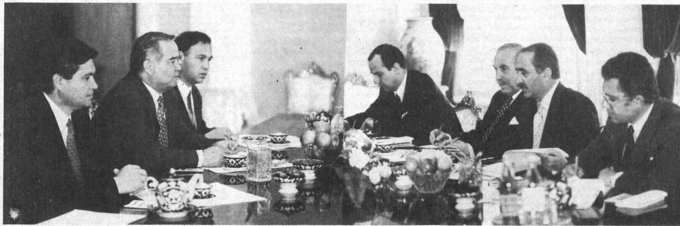
СУРАТДА: қабул пайти.