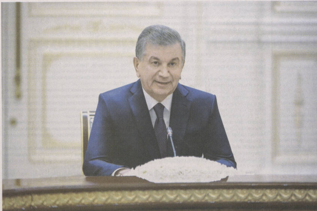
Президент Республики Узбекистан Шавкат Мирзиёев 31 октября принял секретаря Совета безопасности Российской Федерации Николая Патрушева, находящегося в нашей стране с рабочим визитом.

Приветствуя гостя, глава нашего государства с глубоким удовлетворением отметил, что благодаря регулярному и плодотворному диалогу