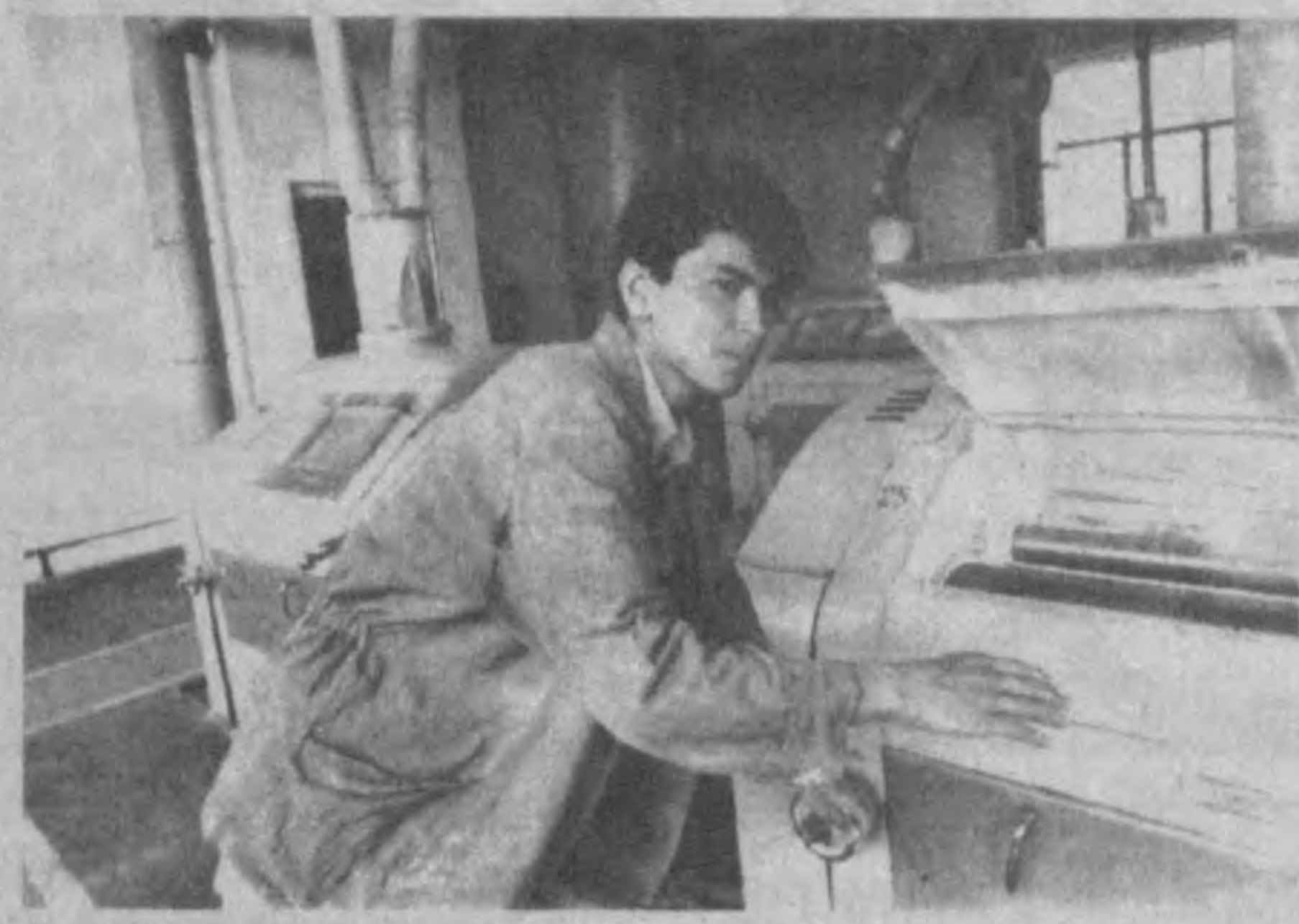
дургического и Янгильского ремонтного опытно-механического заводов. Помимо чисто эконо-

Переход на новую форму собственности в преобразование в акционерную ассоциацию производителей хлебобулочных изделий экономическое положение Нукусского мельзавода. Чистота и слаженность действий всех работников коллектива позволяет предприятию выпускать свою продукцию без потерь и срывов, несмотря на то, что пшеница для переработки поступает сюда в основном из других стран СНГ. Сегодня здесь производится фирменную муку «Узбекистанская» первого и второго сортов.