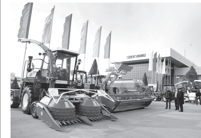
(Давоми. Бошланғич 1-бетда).

Бу республикамизда фаолият кўрсатаётган фермер хўжалиқларининг техника паркини янгилаш, уларни кўп тармоқли субъектларга айлантириш учун замонавий технологияларни жалб этиш, озиқ-овқат саноати корхоналарида эса модернизациялаш лойиҳаларини амалга ошириш учун қўлай фурсатдир. Шу боис кўргазманинг ҳар бир куни қишлоқ хўжалиғи ходимлари, кичик бизнес ва хусусий тадбиркорлик соҳаси вакиллари билан гап-гап. Улар ўзлари қидирган жиҳозларни саралаб, энг мақбулини харид қилишлари учун кўргазма