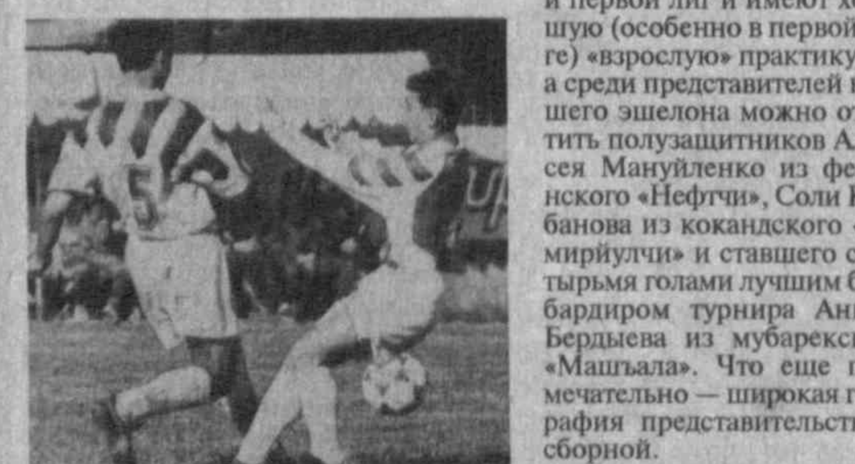
(1977—1978 гг. рождения), Каратау (1979 г.р.) и Ходженге (1980—1981 г.р.) состоялись турниры четырех сборных. Чуть позже, 15—21 мая, в Бишкеке сыграют самые юные, 1982 года рождения. Надо сказать, что эти турниры охватывают те возрастные группы, для которых вплоть до 2000 года уже разработан международный календарь. Приятно отметить (хотя, воз-

С. АРТЕМОВ. НА СНИМКЕ: эпизод матча Узбекистан — Казахстан.