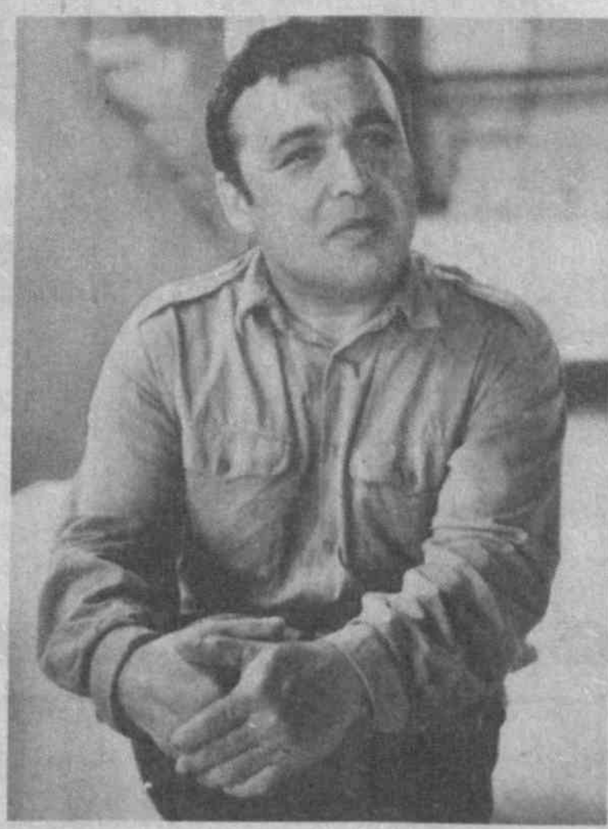
Рынок и его проблемы