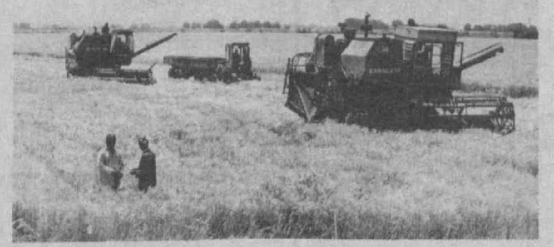
СТРАДА В РАЗГАРЕ

Общественный фонд наступавшего глубокого дефицита счетчиков электроэнергии, который энергичными действиями правительства удалось избежать. Сейчас налаживается производство бытовых электросчетчиков на нескольких предприятиях республики.