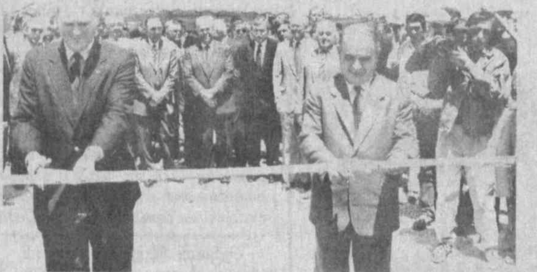
НА СНИМКЕ: во время торжественного открытия предприятия.

Представитель правительства США Ян Калицкий оградил поздравление президента Билла Клинтона коллективу совместного предприятия. На митинге выступили также первый вице-президент Европейского банка реконструкции и развития Рональд Фриман и другие. После церемонии торжественного открытия СП участники митинга ознакомились с деятельностью, техникой «Ньюмонт майнинг корпорейшн», обладающей самой современной в мире технологией, полностью отвечающей и всем экологическим требованиям. Осуществление в краткие сроки уникального проекта для всего СНГ явилось ярким примером все более развивающегося взаимовыгодного сотрудничества между Узбекистаном и США. В торжественной церемонии