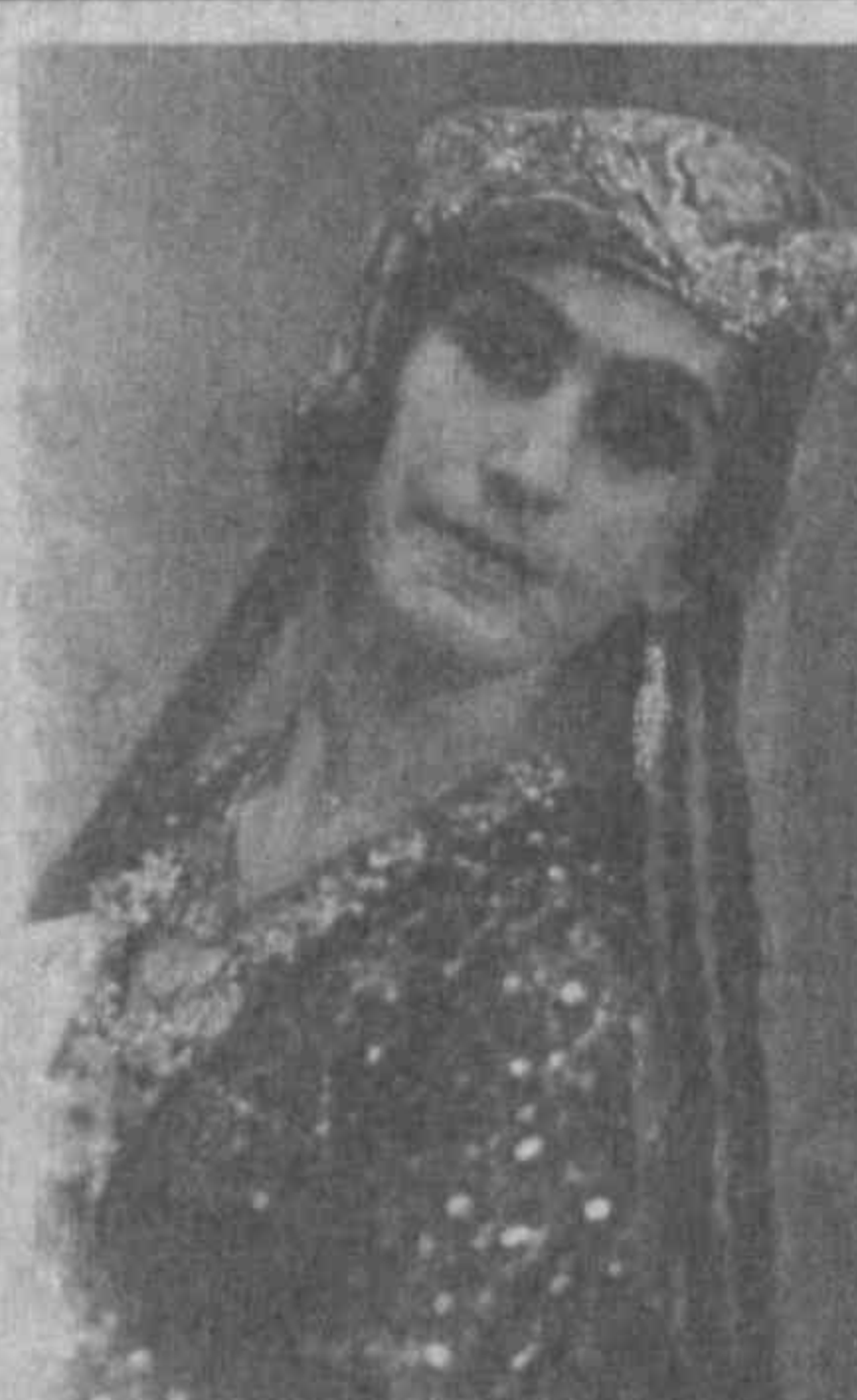
— Возможно ли сочетание фольклорного и классического в танце?