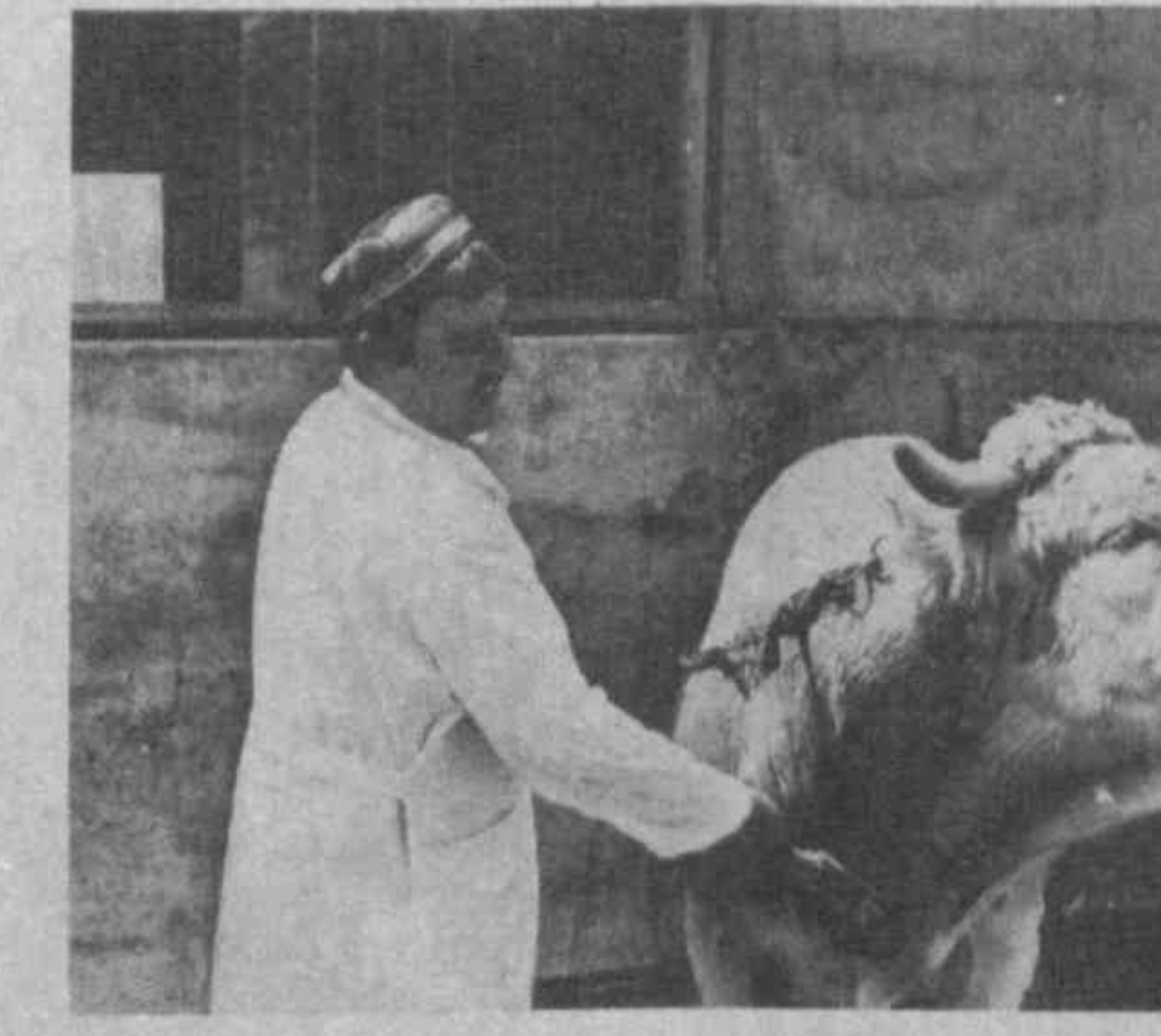
В МВЭС Республики Узбекистан