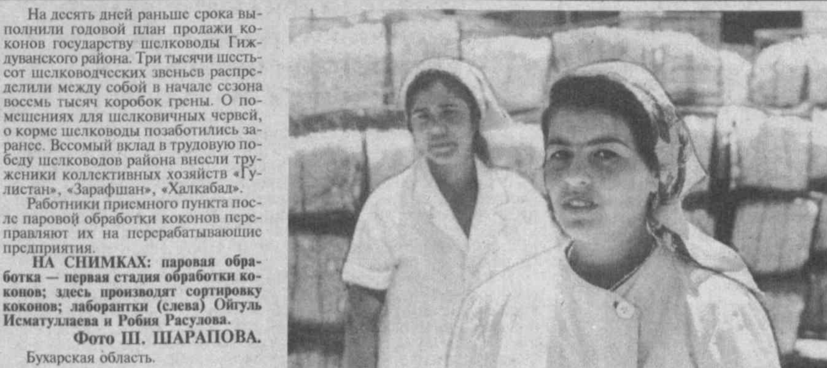
На десять дней раньше срока выполнили головной план продаж коканского государства шелководы Гиждаевского района. Три тысячи шестьсот шелководческих звеньев распределили между собой в начале сезона восемь тысяч коробок гребня. О помещенных для шелководческих червей, о корме шелководов позаботились заранее. Весомый вклад в трудовую победу шелководов района внесли труженники коллективных хозяйств «Гулстан», «Заррафшан», «Халикабад».