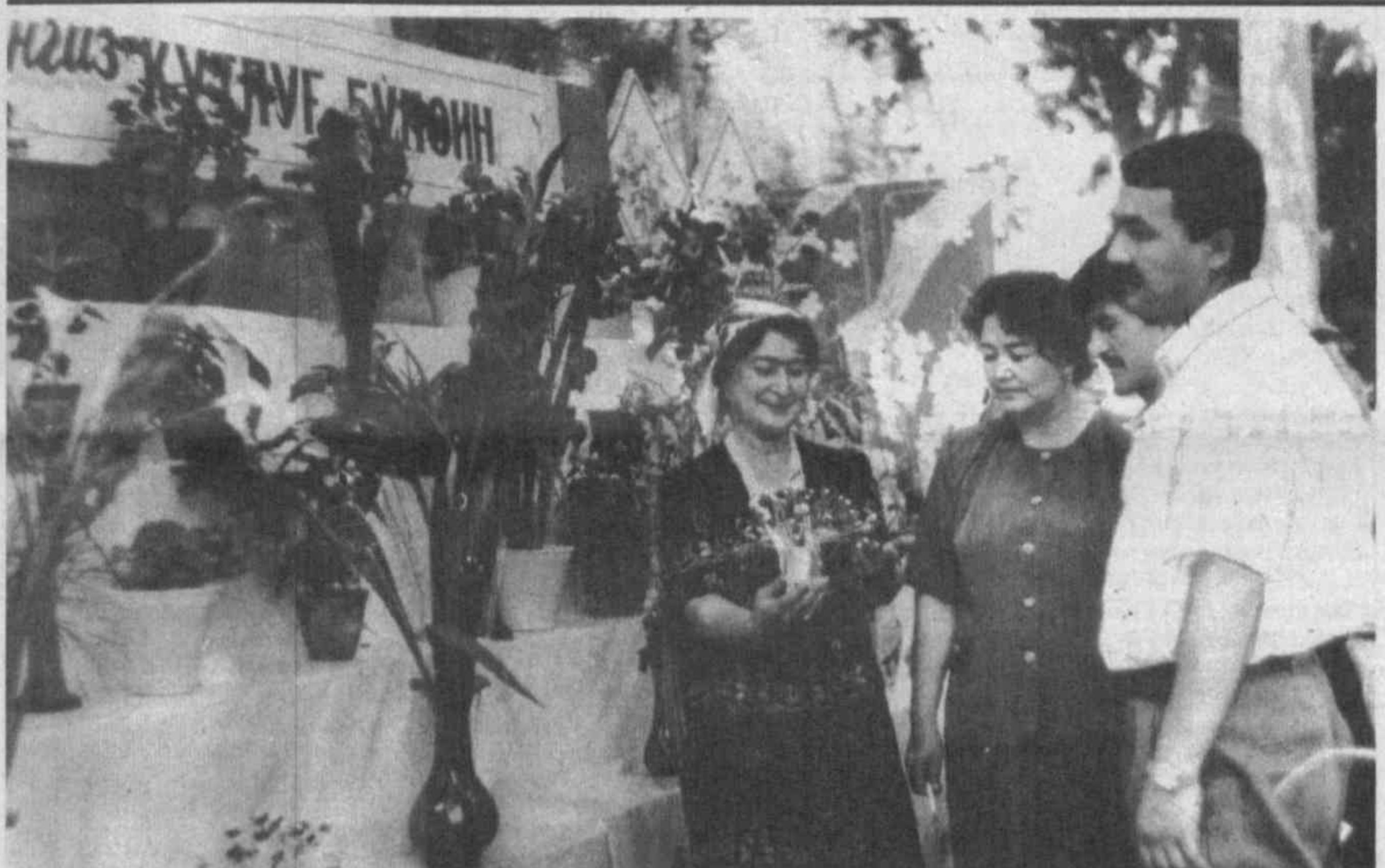
В Намангане прошел традиционный праздник цветов. На нем около 500 учреждений и организаций города выставили свои яркие и ароматные «экспонаты».

«Да, это важнейший аспект — жилищное строительство. Вель современная типовая 4—9-этажная застройка абсолютно неприемлема в данном регионе. Она по сути только усиливает степень экологического бедствия, поскольку дискомфорта, не учитывает климатические условия Центральной Азии. И фактически»