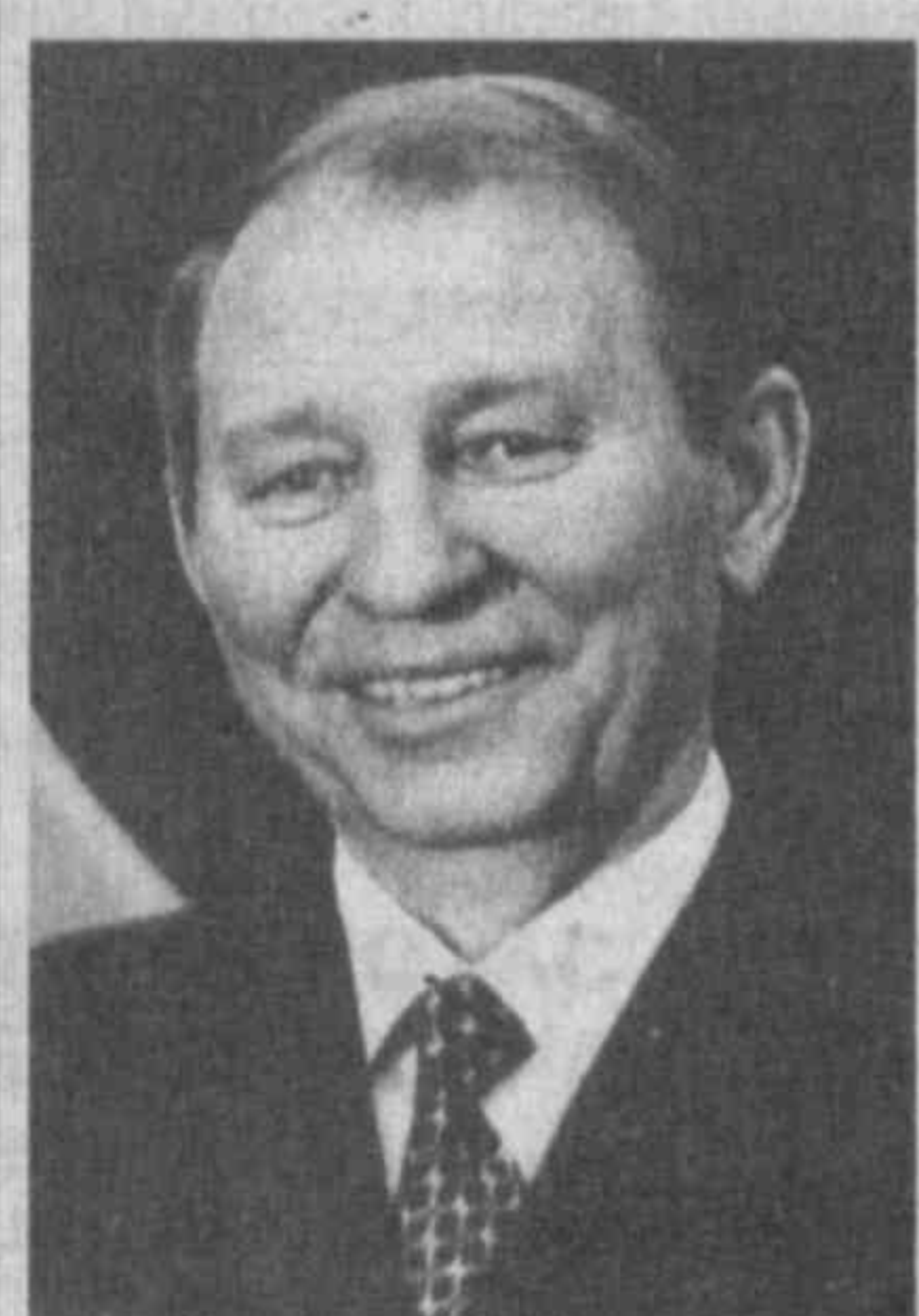
Женат, имеет дочь.

1975—1982 гг. — секретарь партийной организации КБ «Южное». 1982—1986 гг. — первый заместитель генерального конструктора КБ «Южное». 1986—1992 гг. — генеральный директор ракетостроительного концерна «Южный машиностроительный завод» (г. Днепропетровск).