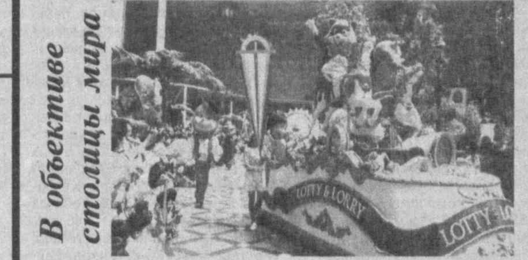
В одном из парков Сеула

Три государства Балтии — Латвия, Эстония и Литва подписали в Люксембурге соглашения с Европейским союзом об ассоциированном членстве. Поставив свои подписи под так называемыми европейскими соглашениями, эти страны в настоящее время занимают свое место в очереди тех государств, которые расчитывают на присоединение к ЕС. Благодаря этим соглашениям балтийские страны получают возможность беспрепятственно экспортировать свои товары на территорию Евросоюза. В договоре также упоминается перспектива последующего членства в Европейском союзе в более поздние сроки. В дополнение к трем странам Балтии договоры об ассоциированном членстве с ЕС подписали девять восточно-европейских государств.