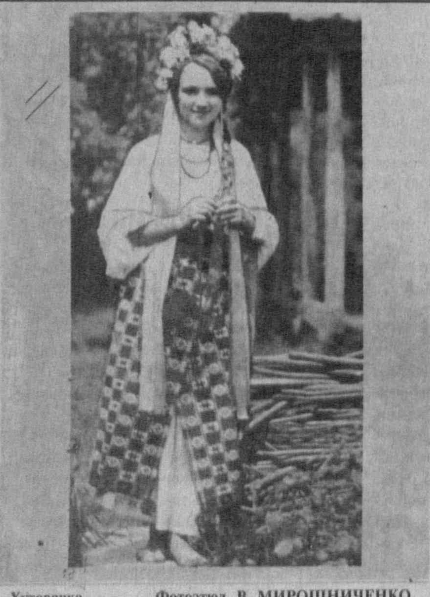
Хуторякка.

президенты АН стран СНГ. На первом своем заседании мы приняли решение обратиться к Леониду Даниловичу Кучме с просьбой о поддержке единого научного пространства. Эту идею он