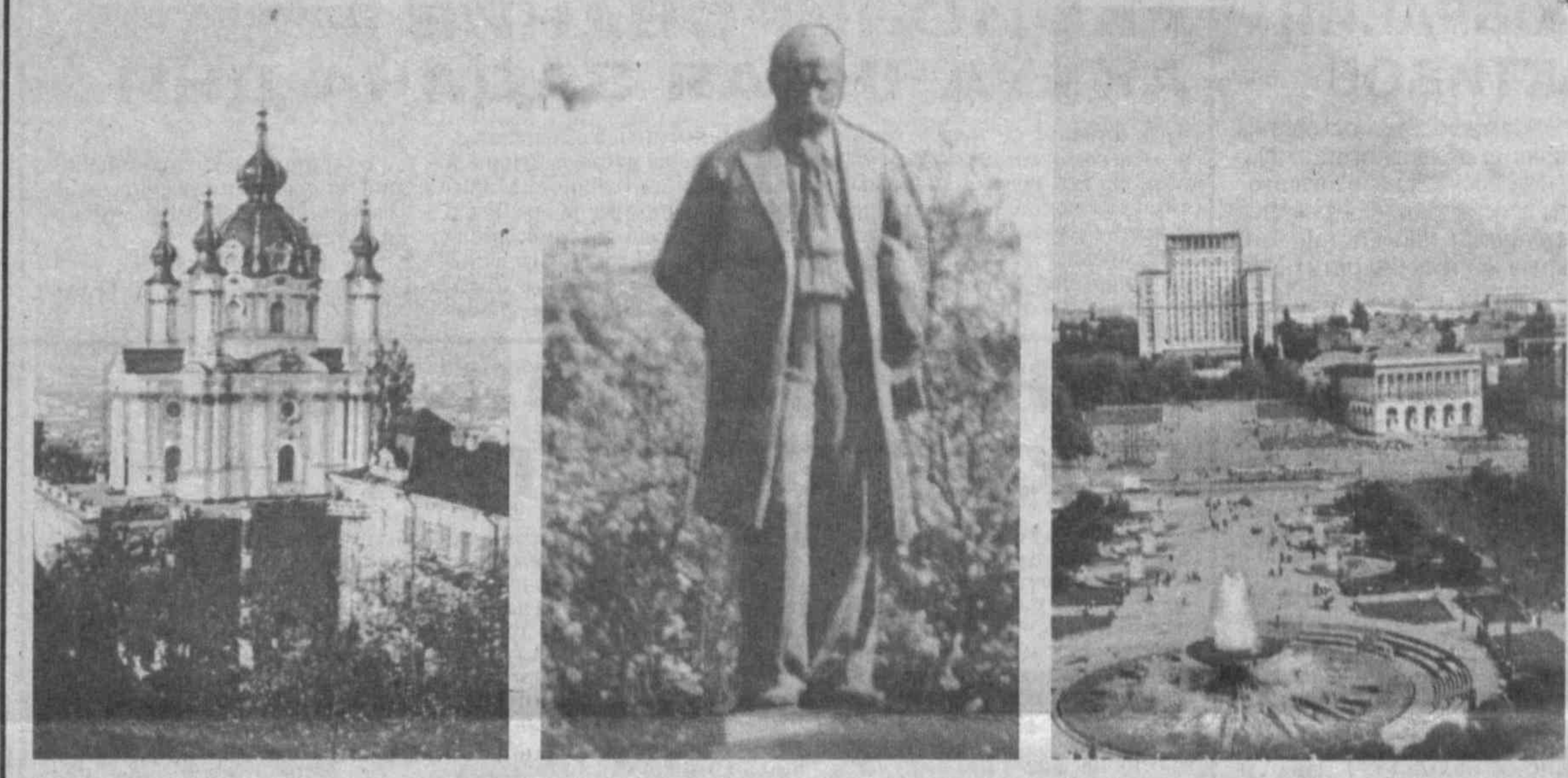
Сегодняшний облик столицы Украины.

НАСЕЛЕНИЕ Из общего количества населения в 52 млн. чел. украинцев около трех четвертей (до 40 млн.), свыше 20 процентов русские, остальные — евреи, белорусы, молдаване, болгары, поляки, венгры, греки, немцы, крымские татары и другие. Кроме украинского, большинство населения владеет русским языком, на западе и юге распространены также польский, венгерский, румынский языки.