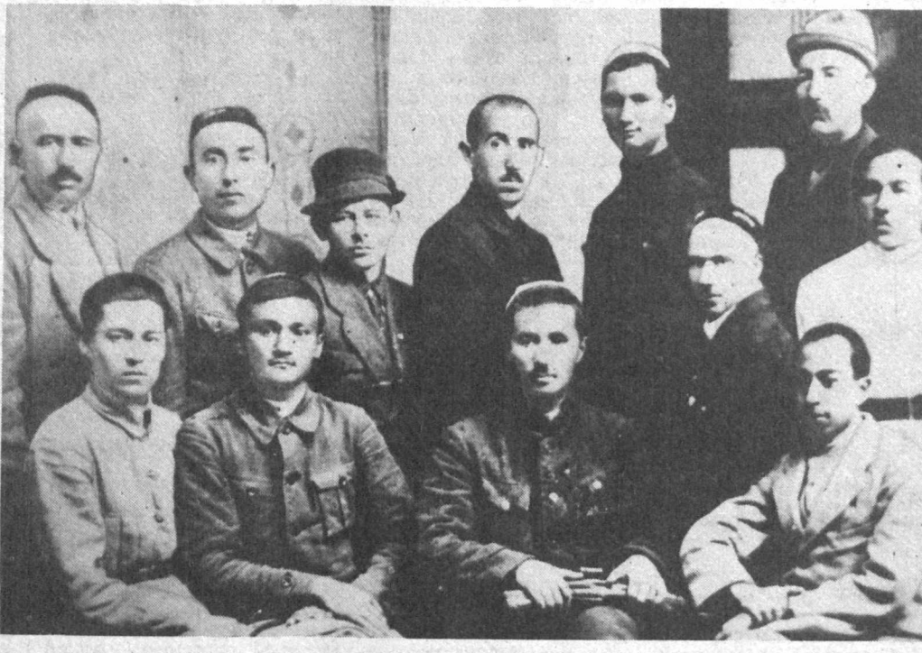
СУРАТДА: Абдулла Қодирий — дўстлари даврасида.