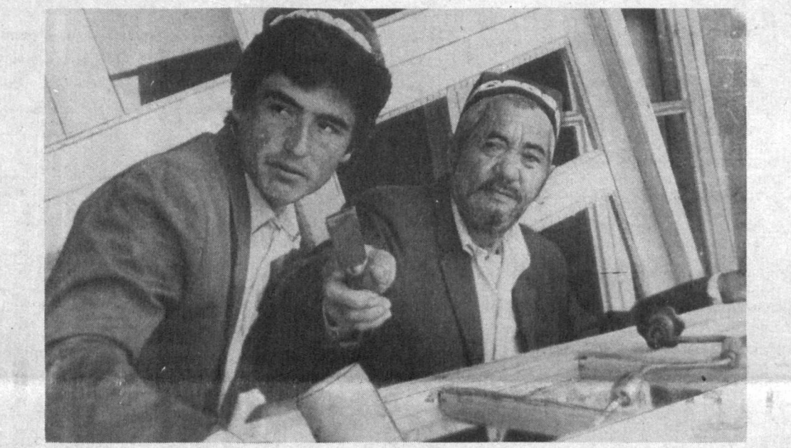
«Халқ сўзи» мухбири. «Халқ сўзи» мухбири.