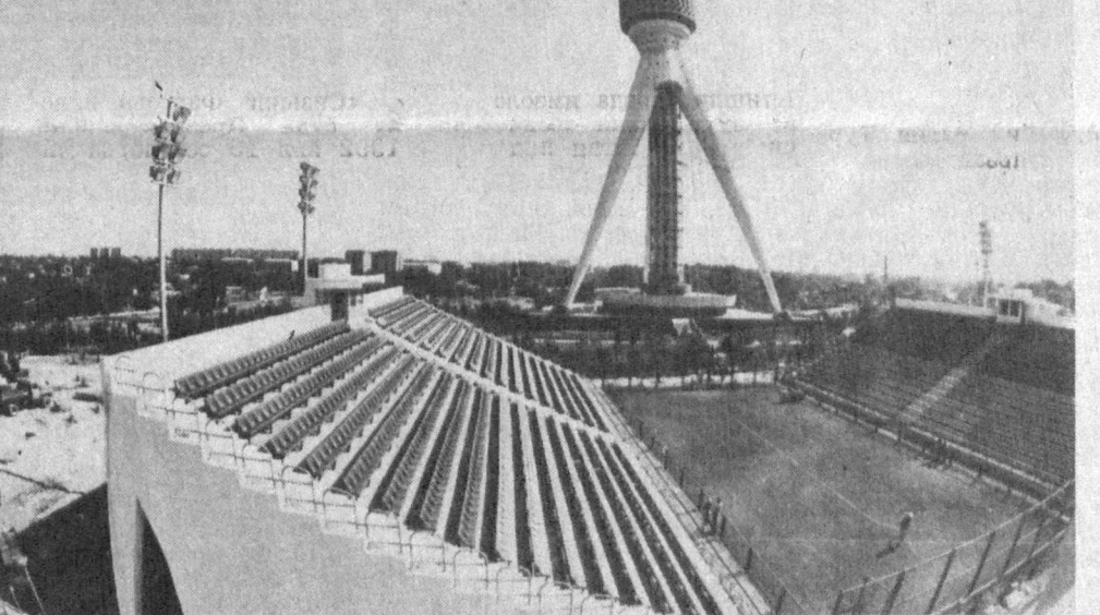
СУРАТДА: «Юнусобод» спорт соғломлаштириш...