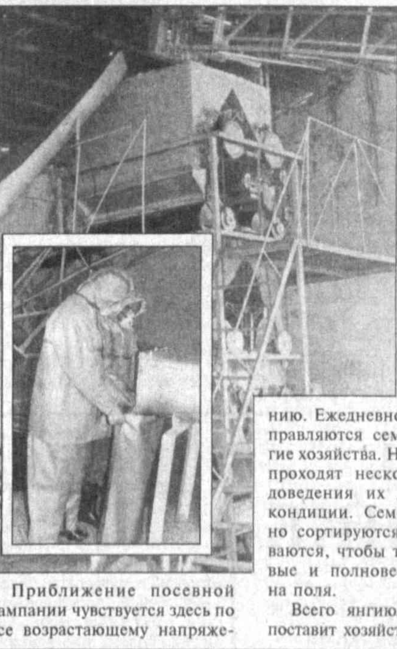
Приближение посевной кампании чувствуется здесь по все возрастающему напряжению.