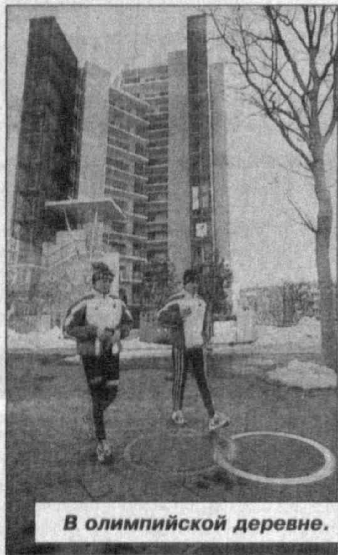
В олимпийской деревне.

Пересказывать ход церемонии открытия Игр, непосредственными свидетелями которой стали 50 тысяч болельщиков, присутствовавших на стадионе, и еще почти миллиард телезрителей, вряд ли есть смысл. Зато нельзя не сказать о том, что глубоким смыслом организаторы постарались наполнить тщательно продуманный сценарий открытия. Центральными фигурами на этом празднике спорта, проникнутом идеей единения Востока и Запада, стали 235-килограммовый борец сумо "Йокодзуна" Акебоно — Великий чемпион, пользующийся в Японии бешеной популярностью, несмотря на то, что родился на Гавайях (США), и миниатюрная фигуристка Мидори Ито, весящая всего 43 килограмма, — серебряный призер Олимпийских игр 1992 года в Альбервилле, экс-чемпионка мира, популярная в Японии, по утверждениям местных журналистов, даже больше Акебоно.