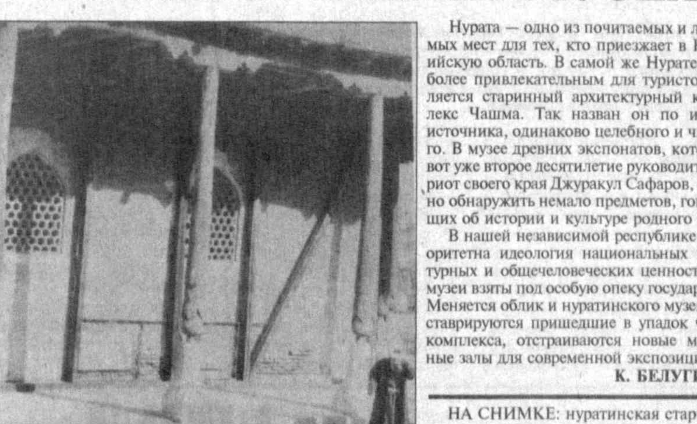
НА СНИМКЕ: нуратинская старина.