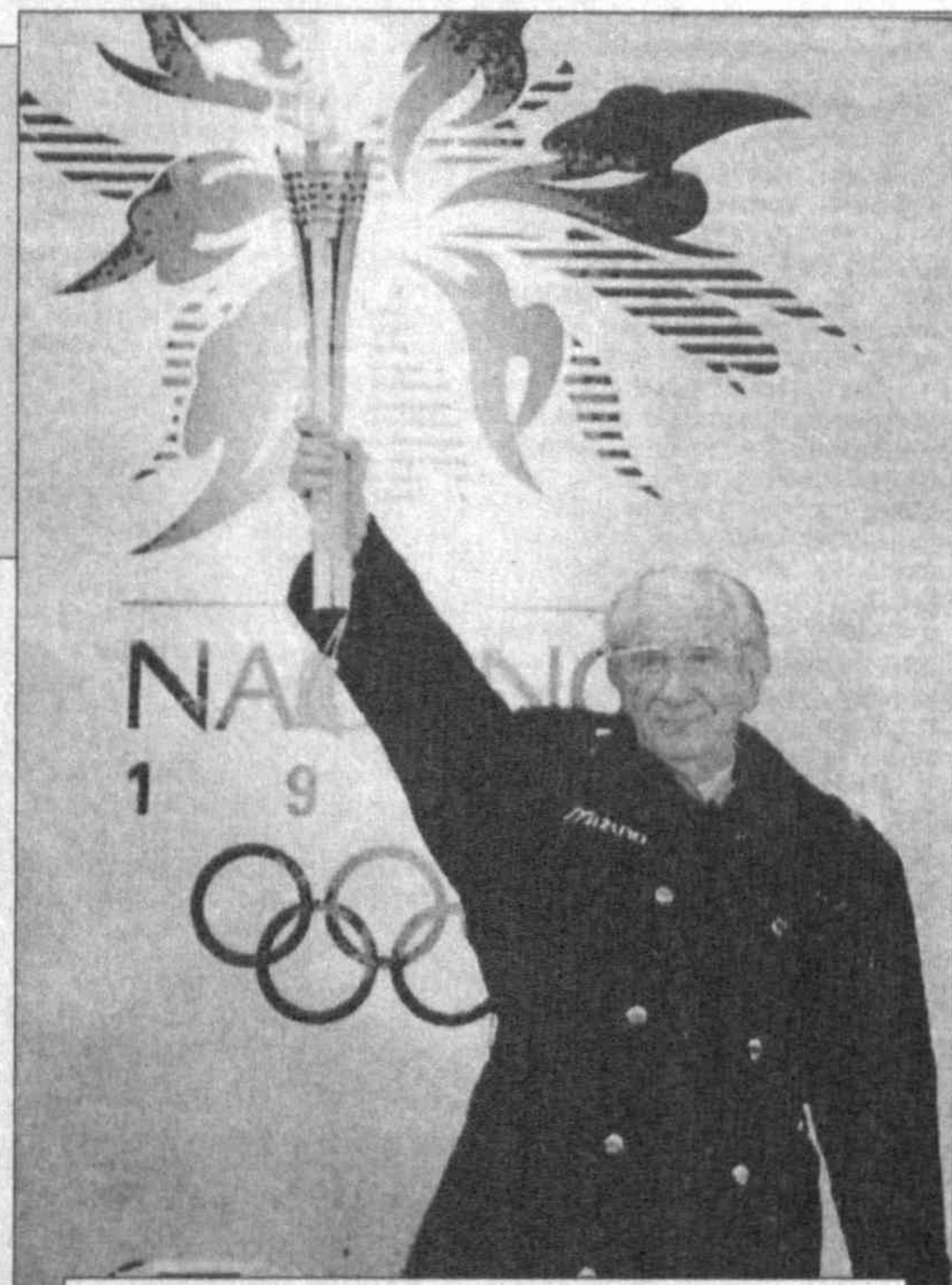
Олимпийский факел — в крепкой руке президента Международного олимпийского комитета Хуана Антонио Самаранча.