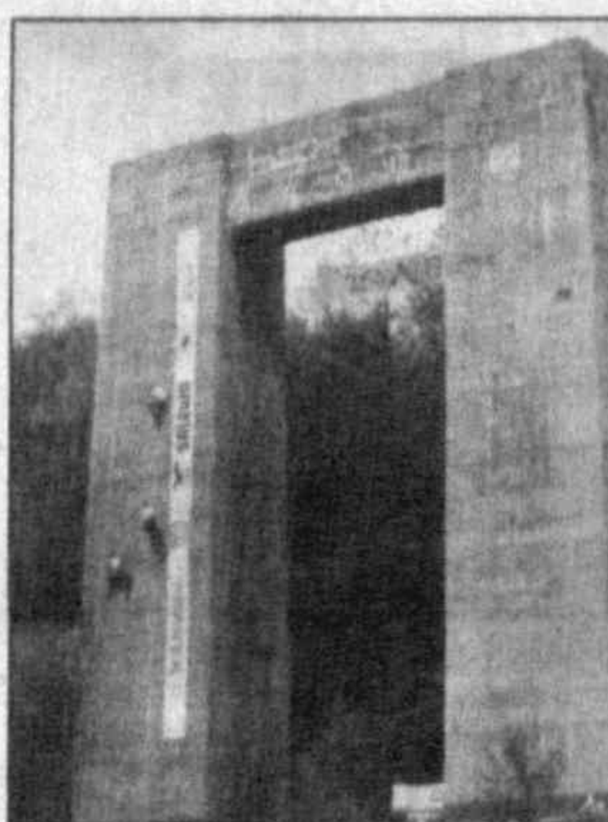
действующих при чрезвычайных ситуациях, монтажно-высотников, гидов туристских фирм.

Скальные соревнования. Скалолазание... Когда-то это был национальный вид, а теперь во всем мире — один из самых распространенных. В период его зарождения (1947 год, скалы Ставрополя) им занимались на естественных скальных участках. Сейчас, как правило, все происходит на искусственных скалодромах, зачастую сооружаемых в крытом помещении. Побольше за бегущих по скалам собираются тысячи зрителей.