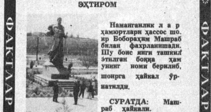
НАМАТГАЛИК Л А Р ҲАМЮРТЛАРИ ҲАССОШ О Р БОБОРАҲИМ МАШРАБ БИЛАН ФАХРЛИНАШАДИ. ШУ БОИС ЯНГИ ТАШКИЛ ЭТИЛГАН БОҚДА ҲАМ УНИНГ НОМИ БЕРИЛДИ, ШОНРА ҲАЙКАЛ ҲУНАТЛАНДИ.

Мавжуд ўн ярим минг гектар ердаги бедани беш-олти марта ўриб олишга ҳаракат қилинмоқда. Бедзорларнинг 1231 гектари сугориладиган ерлардир. Бу йил 21 минг тонна беда пичани, 57,5 минг гектар ғалла майдонидан 52 минг тонна сомон йиғиштириб олиш режаланган. Айни пайтда 91 та техника воситаси ёрдамида ҳар кун 800—900 гектар майдондаги озуқа ўриляптир. Хашак жамғаришда 2 мингдан зиёд механизатор ва ҳашарчи қатнашмоқда.