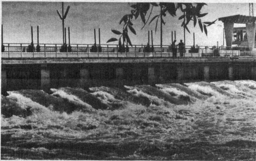
Дарё тўлиб, сувлар оқар...