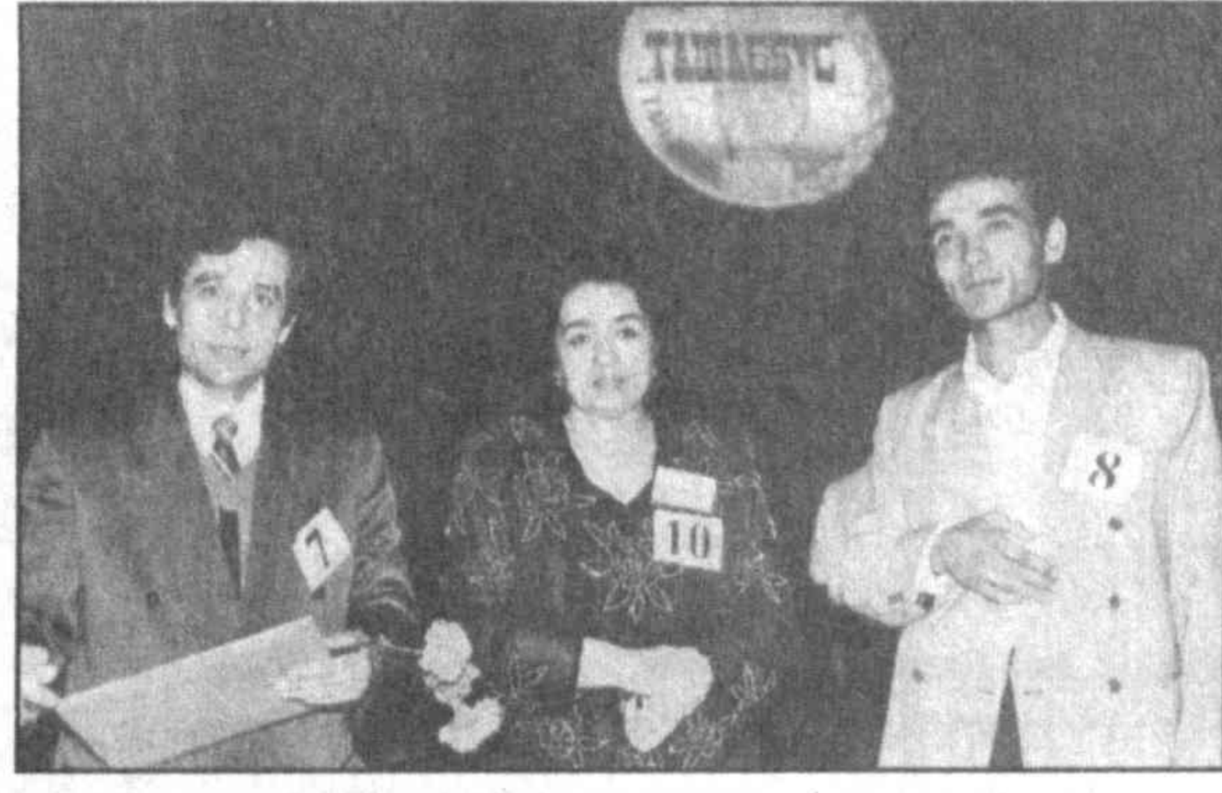
Победители конкурса "Ташаббус-97".

НА СНИМКЕ: победители "Ташаббус-97".