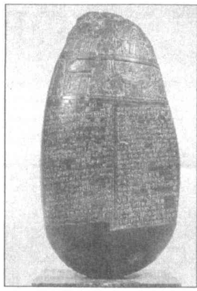
НА СНИМКЕ: вавилонская глина с описанием земли, которую отец дает в приданое дочери (начало XIX в. до н. э.).

ществовавшая практически без изменений 40 веков), в Америке доколумбовой эпохи (маяя и ацтеки) и в традиционной Африке. Наряду с идеограммами появляются насушенная потребность в “зарисовке” самого слова, в транскрипции звуков: так осуществляется переход от конкретных знаков, представляющих предметы, к абстрактному письму, знаки которого символизируют слова и звуки. История алфавитной системы начинается с первых финикийских пиктограмм. Ее продолжат древние греки, введя условные обозначения для звуков. Финикийский алфавит, изобретенный приблизительно 3.000 лет назад, произвел на нашу эпоху революцию в письменности. Он стал основой почти всех алфавитов мира: