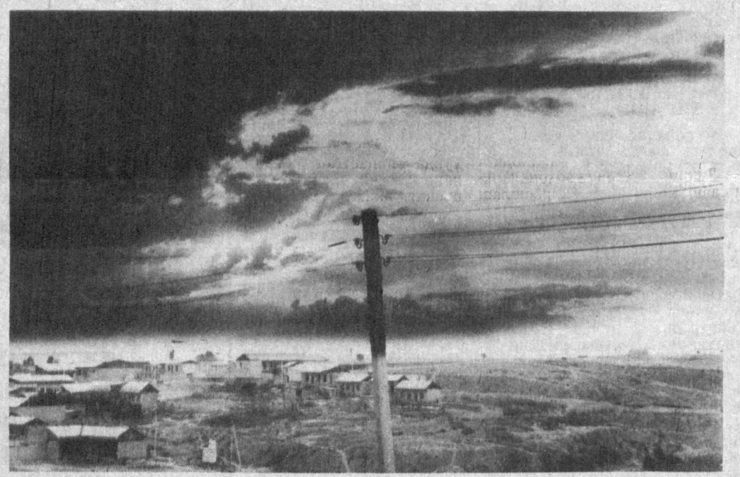
Олис қишлоқ манзараси.

Ўзбекистон Республикаси Вазирлар Маҳкамасининг «Республикада футболни янада ривожлантириш тadbирлари тўғрисида»ги қарори жойларда кенг тadbир этилмоқда.