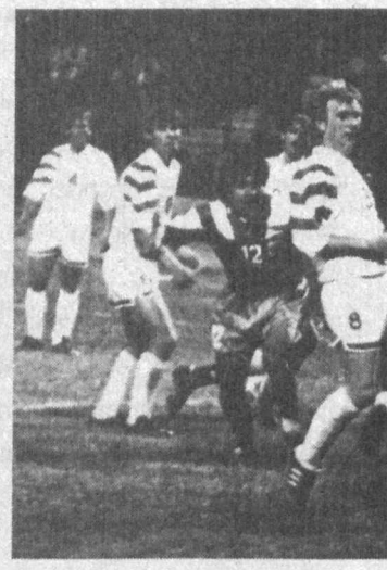
XV жаҳон чемпионатида швейцариялик футболчиларнинг жаҳон сибсатида у тобора муҳим ўрин олаётганини...

са, бу сафар Саудия Арабистони ва Жанубий Корея Осиё қитъасини футбол ботқоқлигидан олиб чиқди. Жанубий Корея азалий хусусияти тезкорлик бобда маҳорат кўрсатиб, XV жаҳон чемпионатида ўзига хос нуфуз қозонган бўлса, Саудия Арабистони жамоаси эса айнан шу хусусият камчилиги боис 1/8 финалда баҳсдан чиқди. Лекин улар ўйинчиларнинг алоҳида тайёргарлиги, маҳорати бобда деярли барча Европа терма жамоаларини ортада қолдирди. Фақат уларда юнанида таъкидлаганимиздек, озгина теъкорлик, ҳужумнинг сўнгги нуқтасида яқунловчи қатъийлик, ўйин тажрибаси етишмади. Бу уларнинг 1/8 финалда Швеция билан ўйинида яққол кўринди.