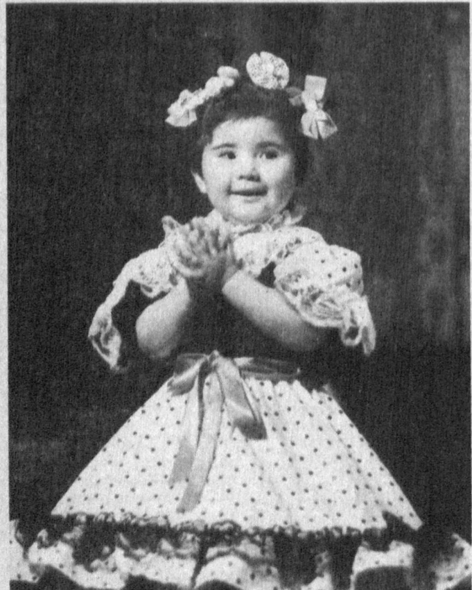
— Виласизни, мен кияман: Мен — Лоламан, Ойпарча