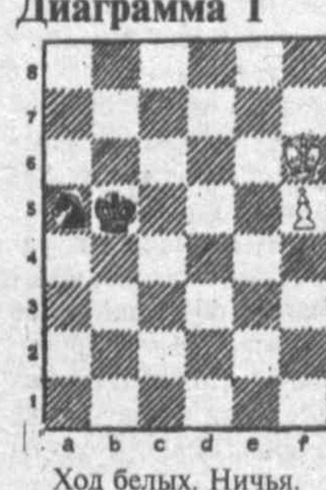
Диаграмма 1. Ход белых. Ничья.

В одном из клубных турниров прайпранку встретился со своим праррадедушкой! Два года спустя в проведенном по телеку матче между сборными командами Нью-Йорка и Лондона (победу одержали американцы 8:4) также участвовали представители самых различных возрастных категорий - от 9 до 90 лет. На "почетной доске" встретились 91-летний американский мастер Эд. Ласкер и его 72-летний английский коллега Мильбер-Берри. Партия ветеранов (в