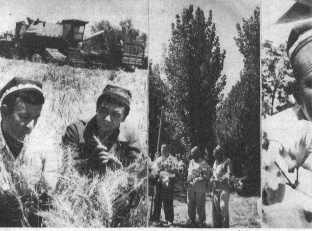
Нарпай туманидаги "Иттифок" ширкатлар уюшмаси 195 гектар суғорилган ердан 700 тоннага яқин бугдой йиғиштириб олд. Ҳозир экиндан бўшаган майдонлар суғорилиб, аввало суғориб экинлар экинмоқда.

Пاختа далаларида ҳам иш чакни эмас. Хар тўр гўзда олти-еттидан кўсам, шунча гўл тўпладан. Ҳосил шохлари атари, Табақчалаштириб чилиш бошланди. Бу ердаги тадбирчи 15 кунда туғалови мўлжалланган.