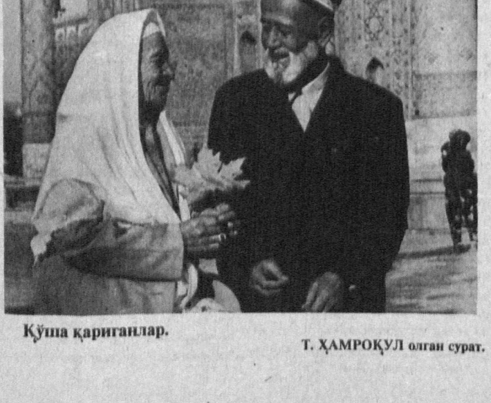
Қўша қарингалар.

Ҳисобот даврда жамиятининг марказий ва виллоят бошқаруви ҳамда бошланғич таълим оқибатлари фаолияти нигорларини иқтисодий хийолаш, уларнинг турмуш фарзандларига атаб бунёд этилган 140 ўринли боғча фойдаланишига топириди.