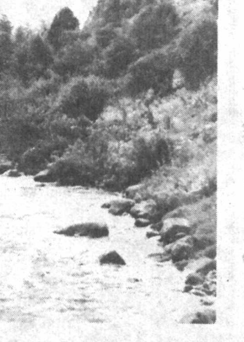
Нақадар гўзалсн она табиат...

“Хасанхон” ўз госяий-бадий оригиналиги билан умумўзбек дostonчилиги муҳитида яққол ажралаб турадиган анъанавий дostonдир. Унда “Гўрўгли” туркунига хос бир бадий конунат аниқ кўзга ташланади. Бу силсила дostonларида Гўрўгли — бош қаҳрамонинг ўзинга эмас, уни ўраб турган инсоний муҳит, Юнус пари, Мисқол пари, Гулнор пари, Холжувон ойм, қирқ йигит ҳам алоҳида тарзда кўрсатилади. Идеал эпик қаҳрамон ва эпик муҳит бир-бирини ичдан нурлантиради. Бу халқ бадий тафаккурининг романвий микёси, баркамоллигини, ҳозиржавоблигини намойиш қилади.