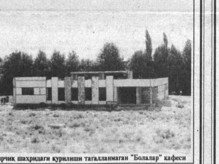
Чирчиқ шаҳридаги қурилиш тагалланмаган “Болалар” кафеси

Ишоотни сотиб олган харидор бир йўла унинг ускуналари ва ер майдонига эга бўлади.