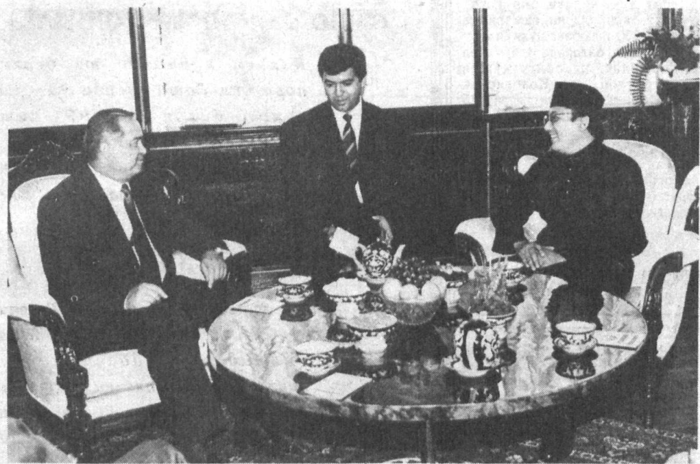
Суратларда қабул пайти:

Ўзбекистон Республикаси Президенти Ислам Каримов 11 август кунини Малайзиянинг мамлакатимиздаги фавқулодда ва мухтор элчиси этиб тайинланган Муҳаммад Ризвон бин Муҳаммад Кушаирини қабул қилди. Элчи республикамиз раҳбарига ишонч ёрлигини топширар экан, Малайзия