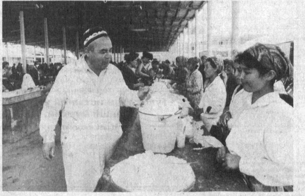
Оқтош шаҳар санитария бўлими атроф-муҳитни экологик тоза сақлаш, соғлиқни муҳофаза қилиш йўлида хайрли ишларни амалга ошираётди. СНБ ходимлари шаҳардаги мавжуд мактаб, болалар богчаси, ҳунартехника билим юртиларида тушунтириш ишлари олиб борилаётгани натижасида болалар ўртасида юқумли касалликлар кескин камаймоқда...

СУРАТДА: Оқтош шаҳрида санитария назорати бўлими ходимлари деҳқон бозорига.