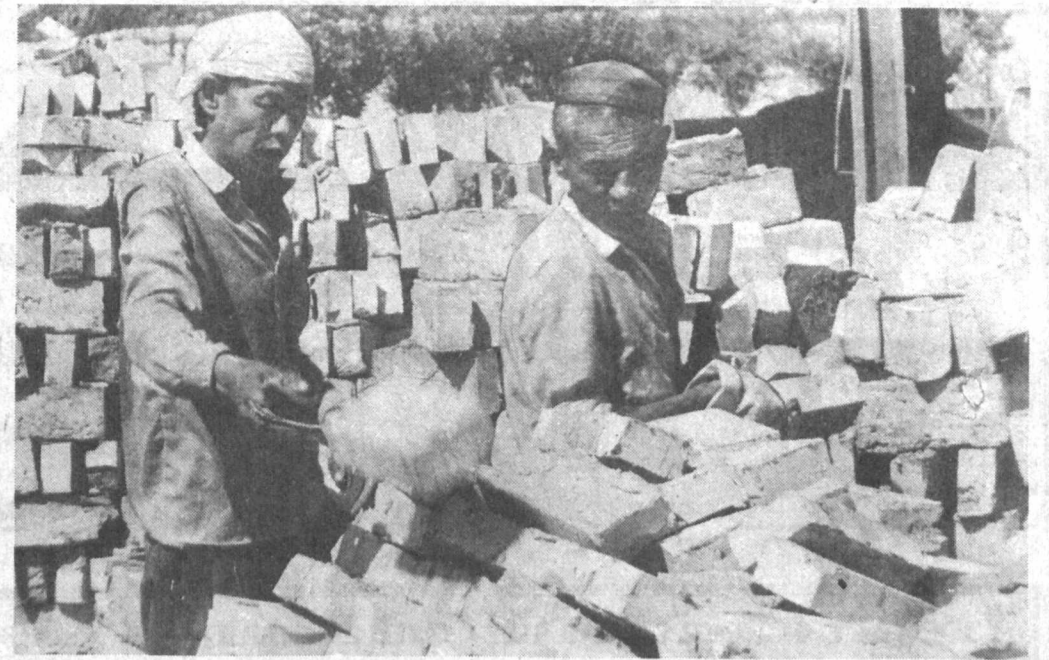
Кувасой шаҳридаги "Кварц"

кейин тикув цехи очиб, аелларимизни иш билан таъминлаймиз" деди. Дарвоқе, республикамизнинг "Деҳқон хўжалиги тўғрисида"ги қонунида: "Деҳқон хўжалиги хар бир хўжалик йилининг охирида ижарага берувчи ихтиёрига шу йилда ижарага олинган пахтанинг 80 фоизини жамоа хўжалигига давлат харид нархида тоширади. Хўшнинг қолган қисми хўжалик ихтиёрида қолдирилади дейилган. Агар шундай бўлса, улар 12,5