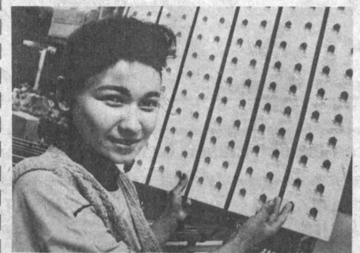
Мамлакатимизда давом этаётган иқтисодий ислохотларнинг биринчи босқичида кўплаб саноат корхоналарида тамак тоши қўйилди.

атрофида гугурт чиқараёلمиз. Ишларимизнинг кетиши кўнгилдагидек. Иқтисодиётда яратилган эркинликлар тудайли 2 ойдаёқ қарзларимизни уздик.