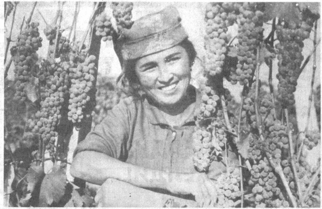
Чўст туманидаги "Говасон" жамоа хўжалиги соҳиб-корлари тўқинчилик йўлида астойдил ҳаракат қилаётганлар. Хўжалик аъзолари бу йил давлатга 700 тонна мева, 4,5 минг тонна узум, 1200 тонна картошка етиштириш ниятида.

7.00 - 9.00 "Ассалом, Ўзбекистон!" Тонгги дам олиш кўрсатуви.