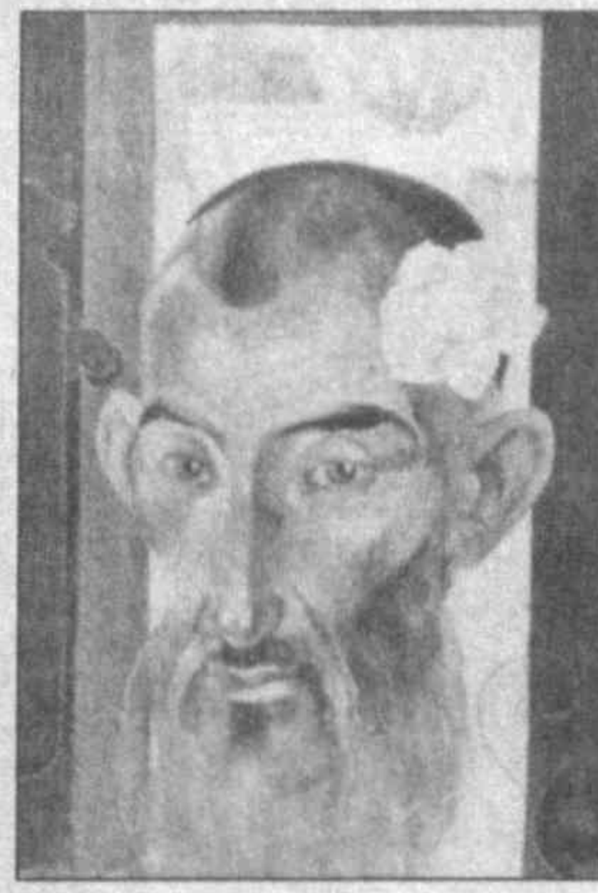
Л. ГУЛИЯНИ, наш общ. корр.

У нас немало успехов, но и достаточный проблем. Различные технические и химические средства, применяемые для сохранения экспонатов, привозятся из других республик. Сейчас возник перерыв в этих поставках. Однако наш музей ни на один день не прекратил своей