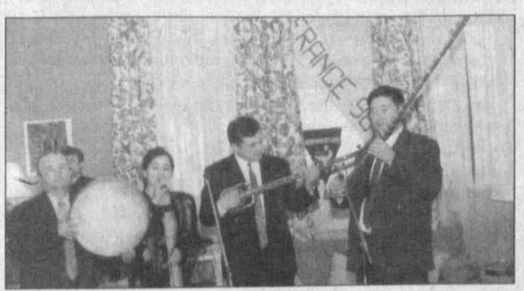
НА СНИМКЕ: концерт народных исполнителей в посольстве Франции в Узбекистане.

В густонаселенном хозяйстве “Янги хайт” Избасканского района Андижанской области вступил в строй новый сельский врачебный пункт.