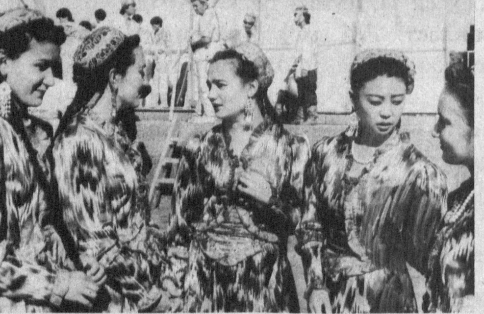
Анджон вилоятининг "Сумалак" халқ дастаси катнашчилари шу кунларда пахта далаларида бўлишиб, меҳнаткашларга концертлар қўйиб беришапти. СУРАТДА: даста катнашчилари.