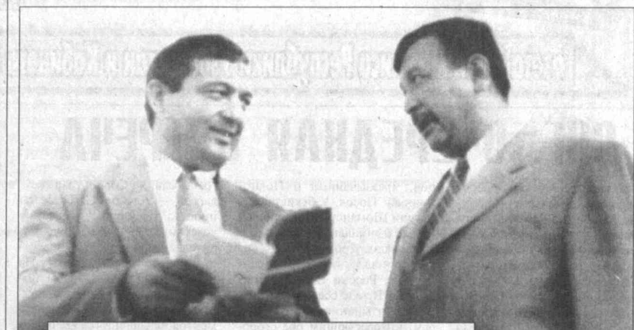
НА СНИМКАХ на 1-й и 2-й стр.: во время регистрации.