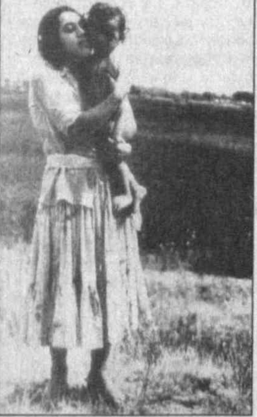
НА СНИМКАХ: обложка альбома фотохудожницы и репродукция одной из ее работ.

Она родилась в Казани, это место ее постоянной прописки. Но ее творческая судьба распрядилась так, что Ляйлиханум всегда находится в пути.