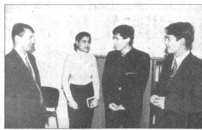
Подготовка национальных кадров — залог формирования процветающего демократического государства.

Большую помощь в решении этого важнейшего для нашей страны вопроса оказывает фонд Президента Узбекистана "Умид" по поддержке обучения одаренной молодежи за рубежом.