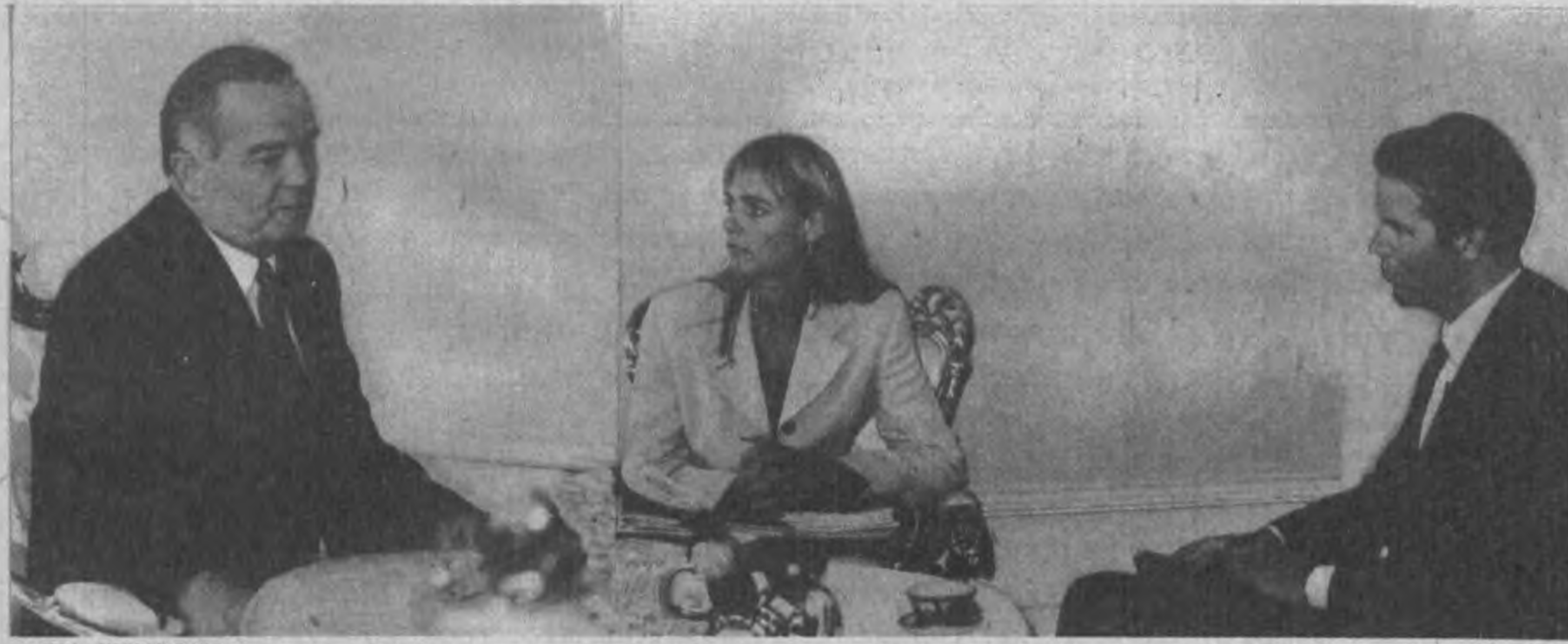
НА СНИМКЕ: во время приема.

Президент Республики Узбекистан Ислам Каримов 19 июля принял корреспондентов независимого информационного агентства «Юнивел» из Великобритании Таиза Боска и Эдриана Беннока.