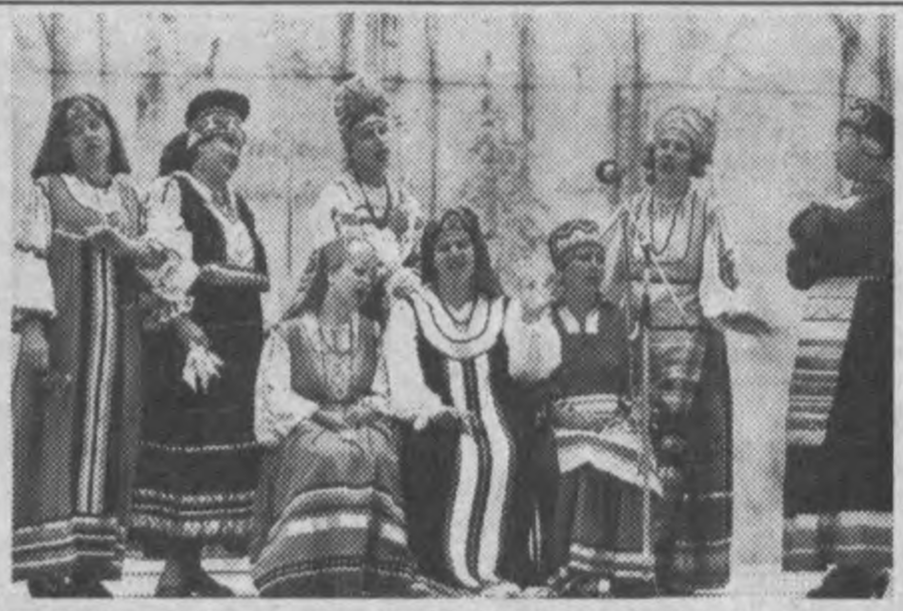
Московская область. В селе Покровское в третий раз состоялся праздник русской песни и романа «Поет Россия наше Подмосковье».

На месяц раньше срока начали жатку хозяйства Оренбургской области. Полным ходом идет уборка озимой пшеницы и ржи в 14 из 35 районов области.