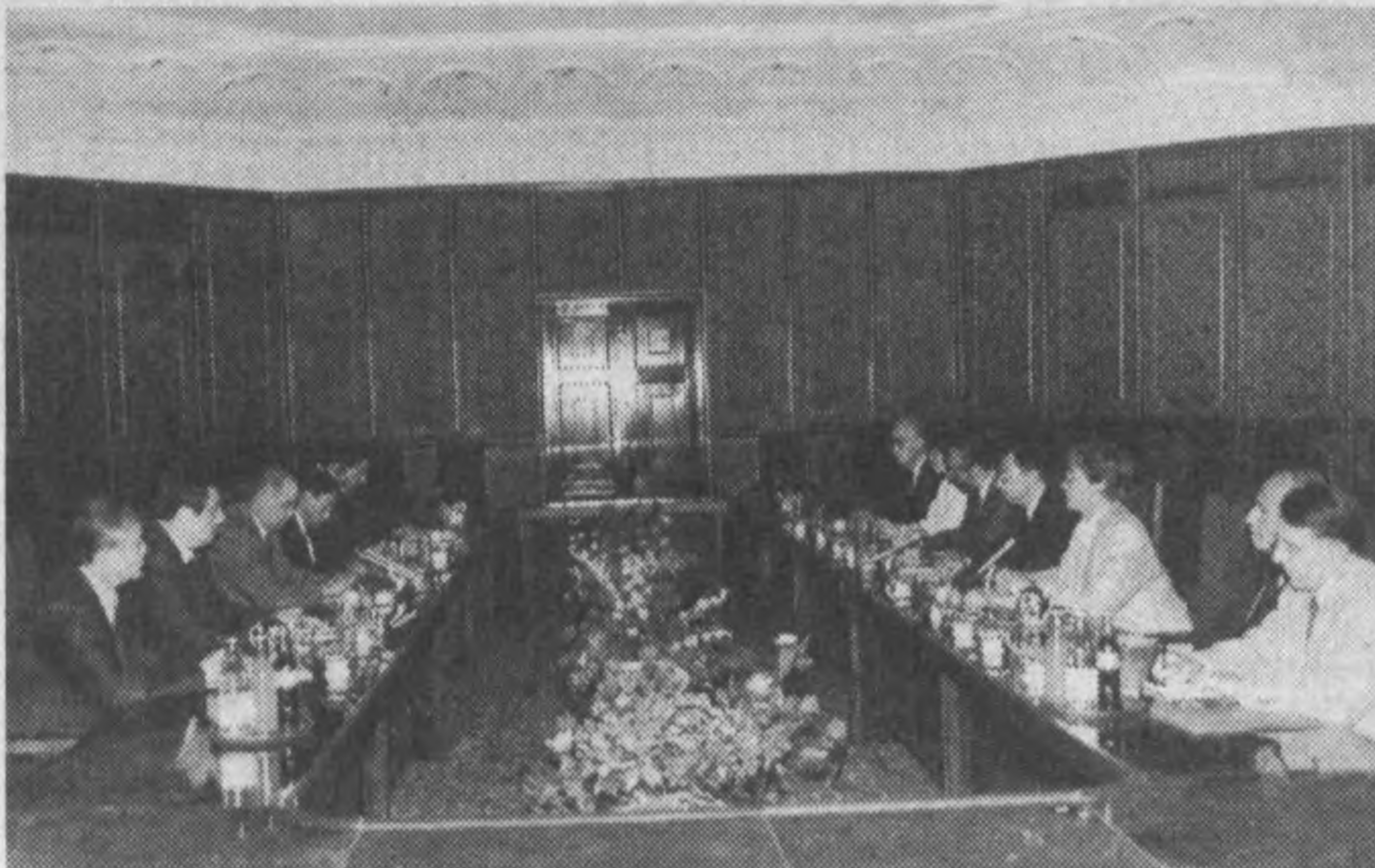
НА СНИМКЕ: во время приема.

В приеме приняли участие заместители премьер-министра Узбекистана У. Султанов, Б. Хамидов, министр юстиции республики А. Мардиев.