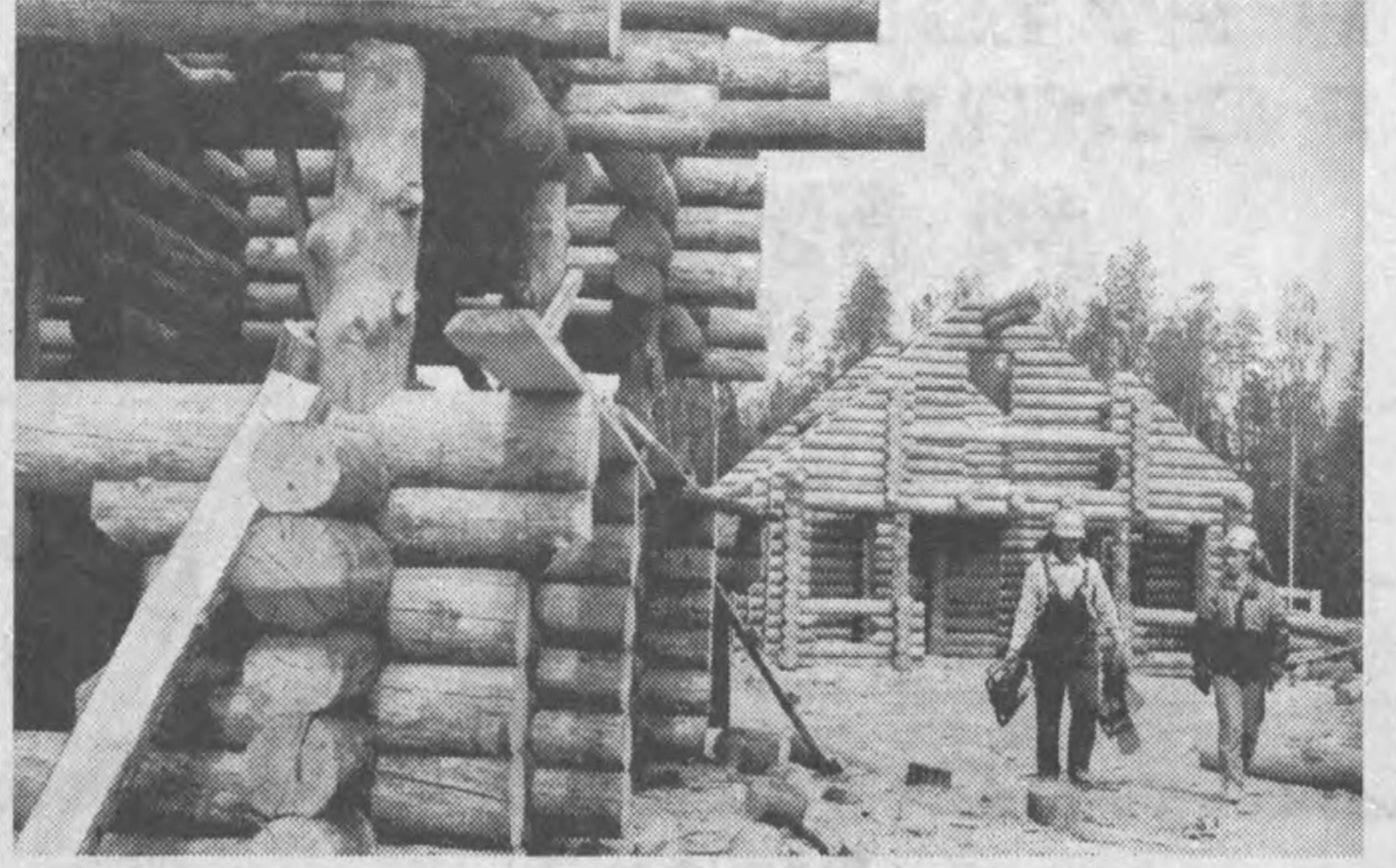
Большие запасы сухостойной древесины, которые есть в Карелии, идут на производство срубов. В скандинавских странах дома из сухостойной древесины пользуются особым спросом.