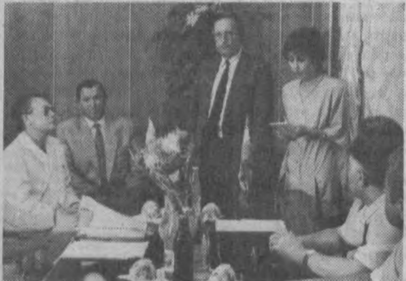
Благотворительная акция — результат дружеских встреч и контактов созданного в 1994 году общества «Германия — Узбекистан»...