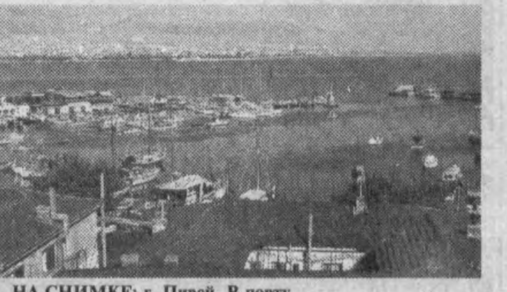
НА СНИМКЕ: г. Пирей. В порту.