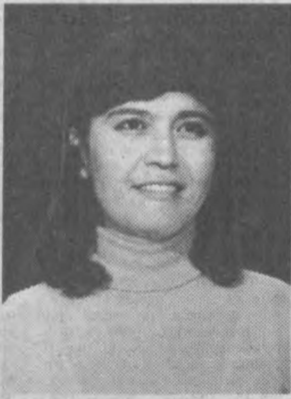
дальнейшего творческого роста. В первую очередь наших детей. Это сейчас главное.

Лауреаты престижных конкурсов эстрады. Их песни радовали многих, запоминались, становились шлягерами. Например, «Песня о Ташкенте» («Звезда Востока»). Начиная с 1978 года они часто выступали по радио, телевидению Ташкента, Москвы и других столиц.