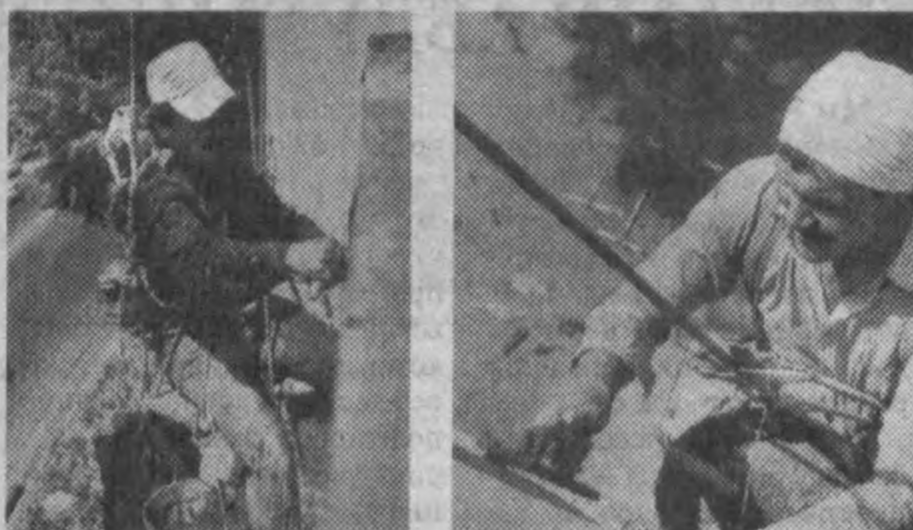
Есть в Ташкенте Республиканский центр быстрого реагирования — аналог подразделений Госкомитета по чрезвычайным ситуациям РФ...