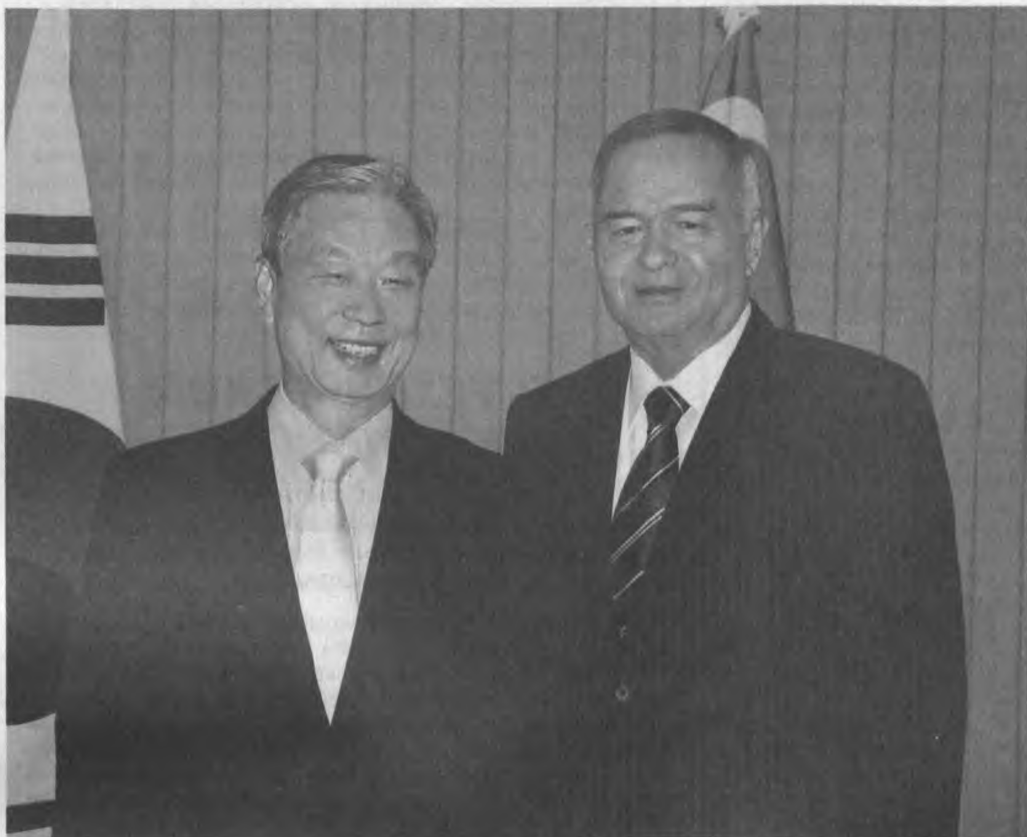
Глава нашего государства 25 февраля принял участие в торжественной церемонии, посвященной официальному вступлению в должность новоизбранного Президента Республики Корея Ли Мён Бака.

Президент Республики Узбекистан Ислам Каримов 24 февраля прибыл в Республику Корея.